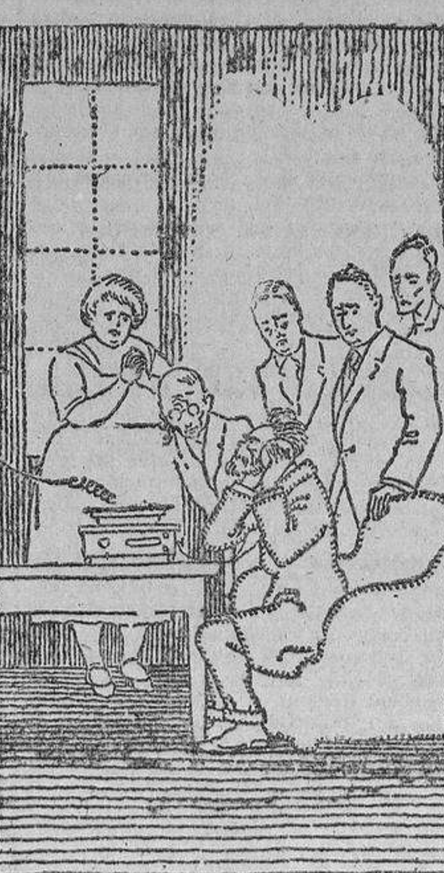
Kraemer no oía nada...

«Vosotros, pobres humanos, no sabéis lo que es la Muerte ni lo que es la Vida. Representáis a la primera con un esqueleto... ¡Menguado saber el vuestro! El esqueleto es materia, y la Muerte nada tiene que ver con la materia.