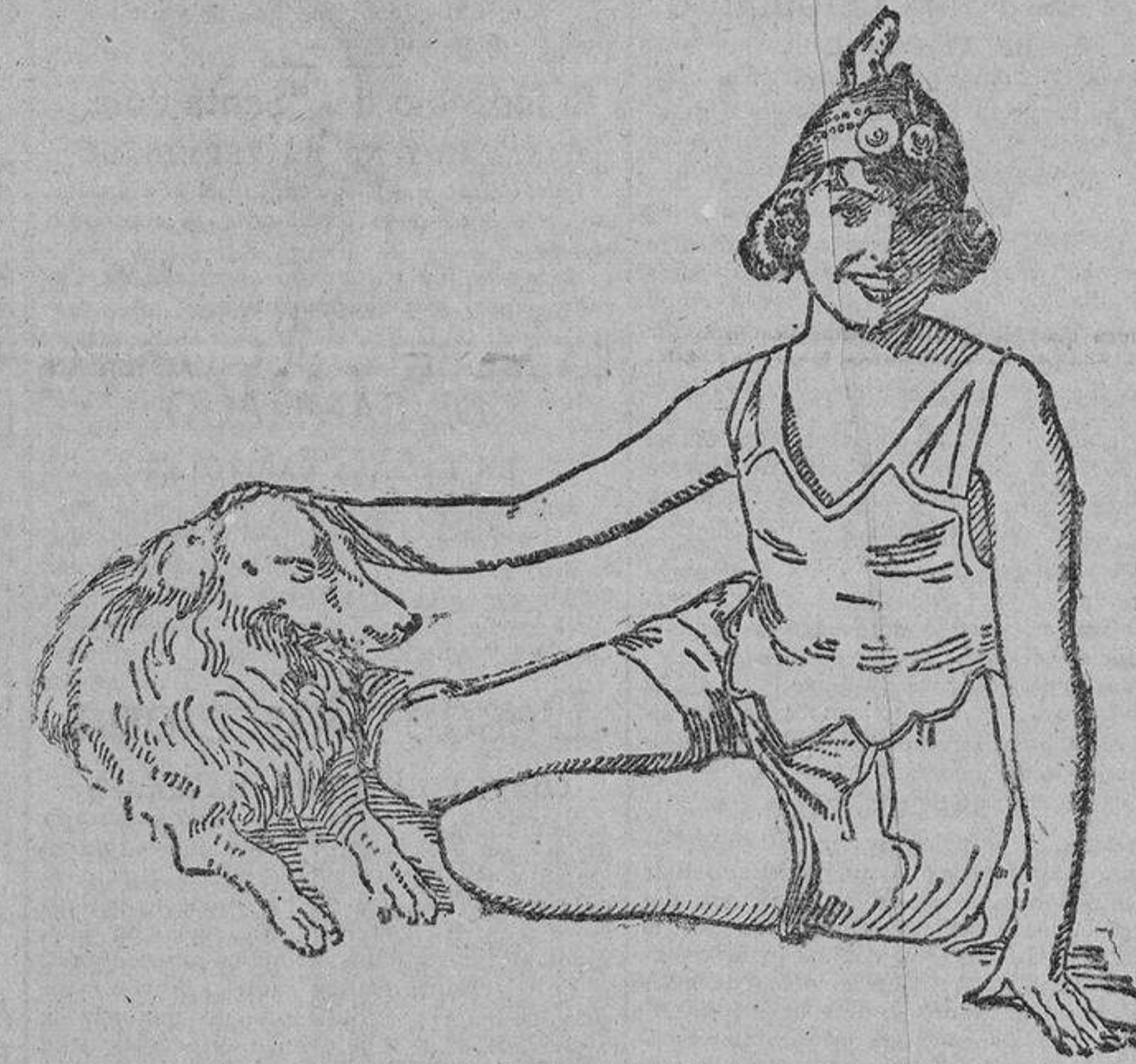
Eminente artista inglesa, acompañada de su hermoso terranova, con el que acaba de «filmar», una obra de gran éxito