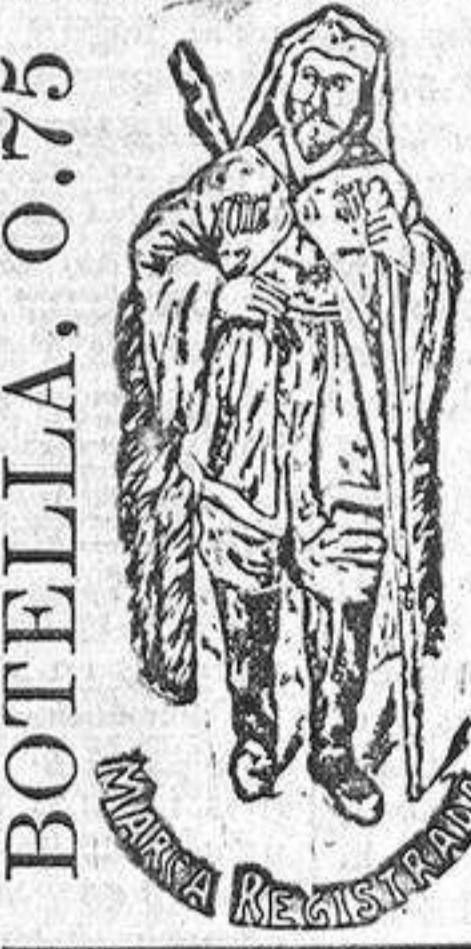
BOTE LLA, 0.75

CASAS DE LUJO Calle de Velazquez, 75. General Orán, 19 y Lagasca, 116, hay cuartos principales para alquilar, gran confort, quince piezas, ascensor, calefacción central, baño, lavabo, bidet, dos W. C., escalera de servicio, teléfono, portero de librea, etcétera, etc. Hay garaje.