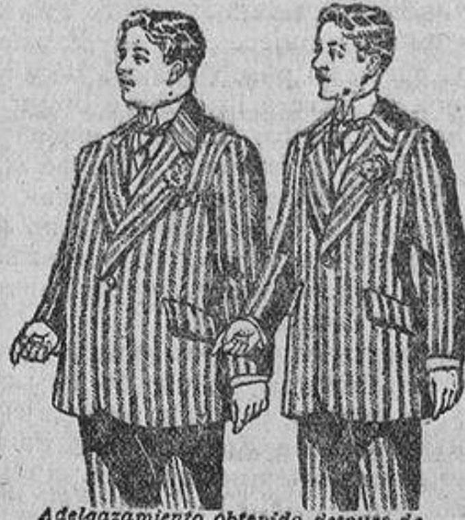
Adelgazamiento obtenido después de 3 meses de cura por la IODHYRINE.

DE VENTA EN TODAS LAS FARMACIAS Y DROGUERIAS.