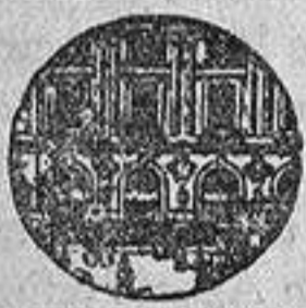
Campo de visión con el Gemelo de Campaña

Esta potencia de 8 veces, es la única adoptada por los COMITES TECNICOS DE ARTILLERIA Y MARINA de Francia, Rusia, Japón, Alemania, etc., permitiendo estos gemelos el mirar a todas las distancias, y AUNQUE EL TIEMPO ESTE BRUMOSO se ve tan bien como con los otros gemelos prismáticos de mayor potencia. Sin embargo, a las personas que tengan que hacer determinadas observaciones, ofrecemos el Gemelo "Solaire" prismático aumentando 12 VECES, extra-luminoso al precio de 150 pesetas.