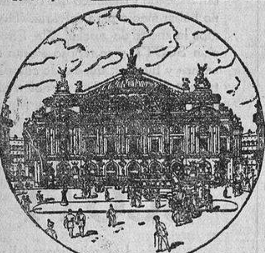
Campo de visión con nuestros Gemelos TELE-STÉREO prismáticos, ó sea 8 veces mayor

Esta potencia de 8 veces, es la única adoptada por los COMITES TECNICOS DE ARTILLERIA Y MARINA de Francia, Rusia, Japón, Alemania, etc., permitiendo estos gemelos el mirar a todas las distancias, y AUNQUE EL TIEMPO ESTE BRUMOSO se ve tan bien como con los otros gemelos prismáticos de mayor potencia. Sin embargo, a las personas que tengan que hacer determinadas observaciones, ofrecemos el Gemelo "Solaire" prismático aumentando 12 VECES, extra-luminoso al precio de 150 pesetas.