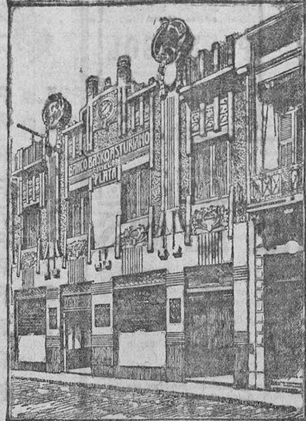
EDIFICIO DEL BANCO

Los grandes Mercados del Plata consumen anualmente del Extranjero productos por valor de 500 millones de pesos oro, y de España sólo 14.