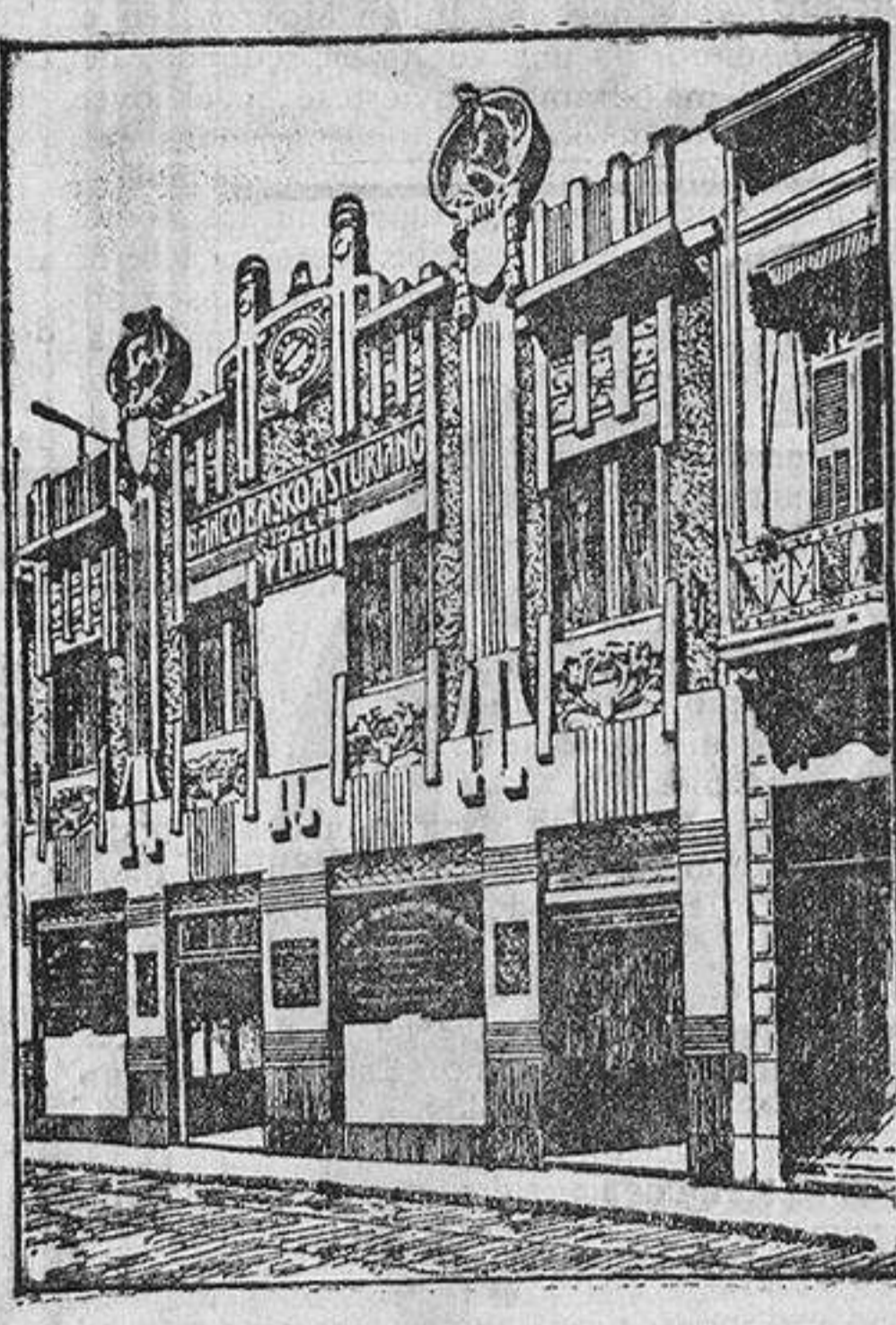
EDIFICIO DEL BANCO

Text describing the Banco Basko-Asturiano del Plata and its services.