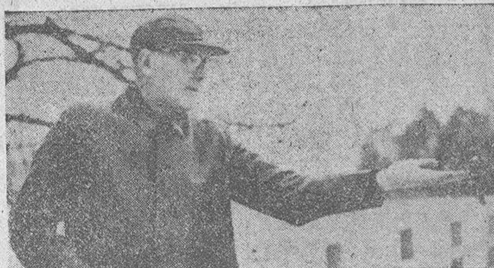
En esta fotografía aparece el presidente de la República finlandesa, M. Urho Kaleva Kekkonen, con un pájaro en la mano. Kekkonen, nacido en 1900, fue designado miembro del Parlamento en 1936 y Ministro y Primer Ministro sin interrupción después de la guerra. Hace tres años fue elegido Presidente de la República. Desde su designación ha abandonado el palacio presidencial para residir en una villa situada a unos kilómetros de Helsinki.

ESTOCOLMO, 2.—Poco antes de emprender el vuelo hacia Varsovia, el vicepresidente Nixon ha celebrado una conferencia de Prensa en la que ha declarado que cree que el jefe del Gobierno soviético, Nikita Kruschev, será invitado a los Estados Unidos "alguna vez". Puntualizó el vicepresidente que expresaba esta opinión sin que ello quiera decir que se haya tomado una decisión con relación al asunto. Naturalmente—dijo—cualquier decisión corresponde al presidente Eisenhower.