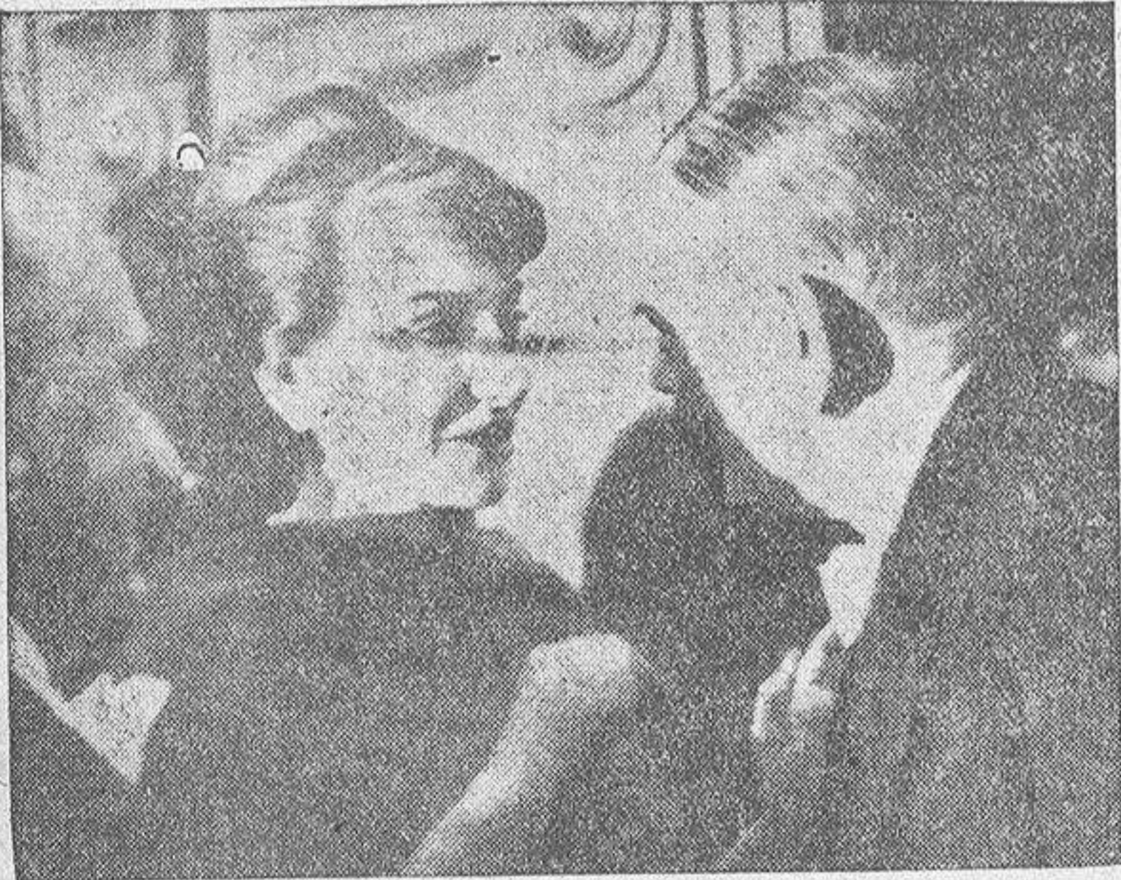
René Coty ha aprovechado la función de gala celebrada en el teatro de la Opera para despedirse oficialmente del "todo París". Al final del primer acto el Presidente de la República acudió a saludar a la famosa cantante Maria Meneghini Callas, que interpretó el principal papel de "Tosca", momento que recoge la foto