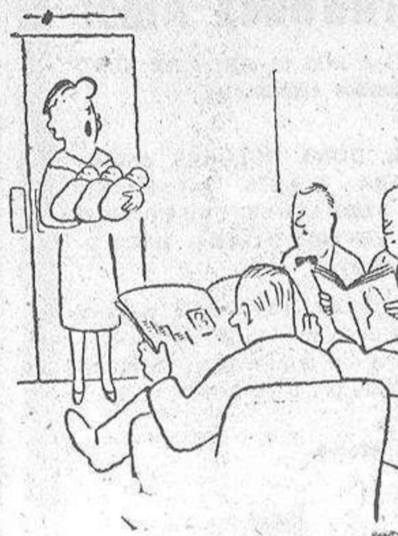
El único que tiene que asustarse es el señor López