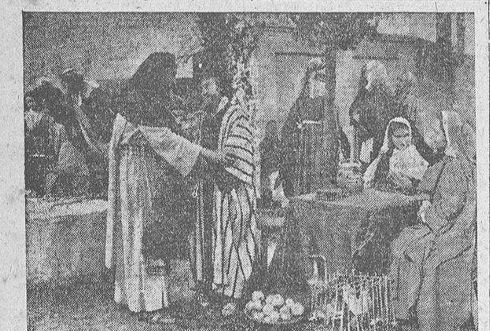
He aquí otra nota del rodaje en exteriores. El sol de los días casi veraniegos cae de plano, y el director grita: "¡Pronto, pronto, que hay muchos niños en escena y puede hacerles mal!"

tista profesional. Durante seis meses el director trabajó incansablemente y examinó ocho mil pruebas fotográficas. Después dialogó con ochocientas muchachas para decidir, finalmente, por la joven que no solamente jamás se había enfrentado con el cine, sino que desconocía cualquier labor de interpretación.