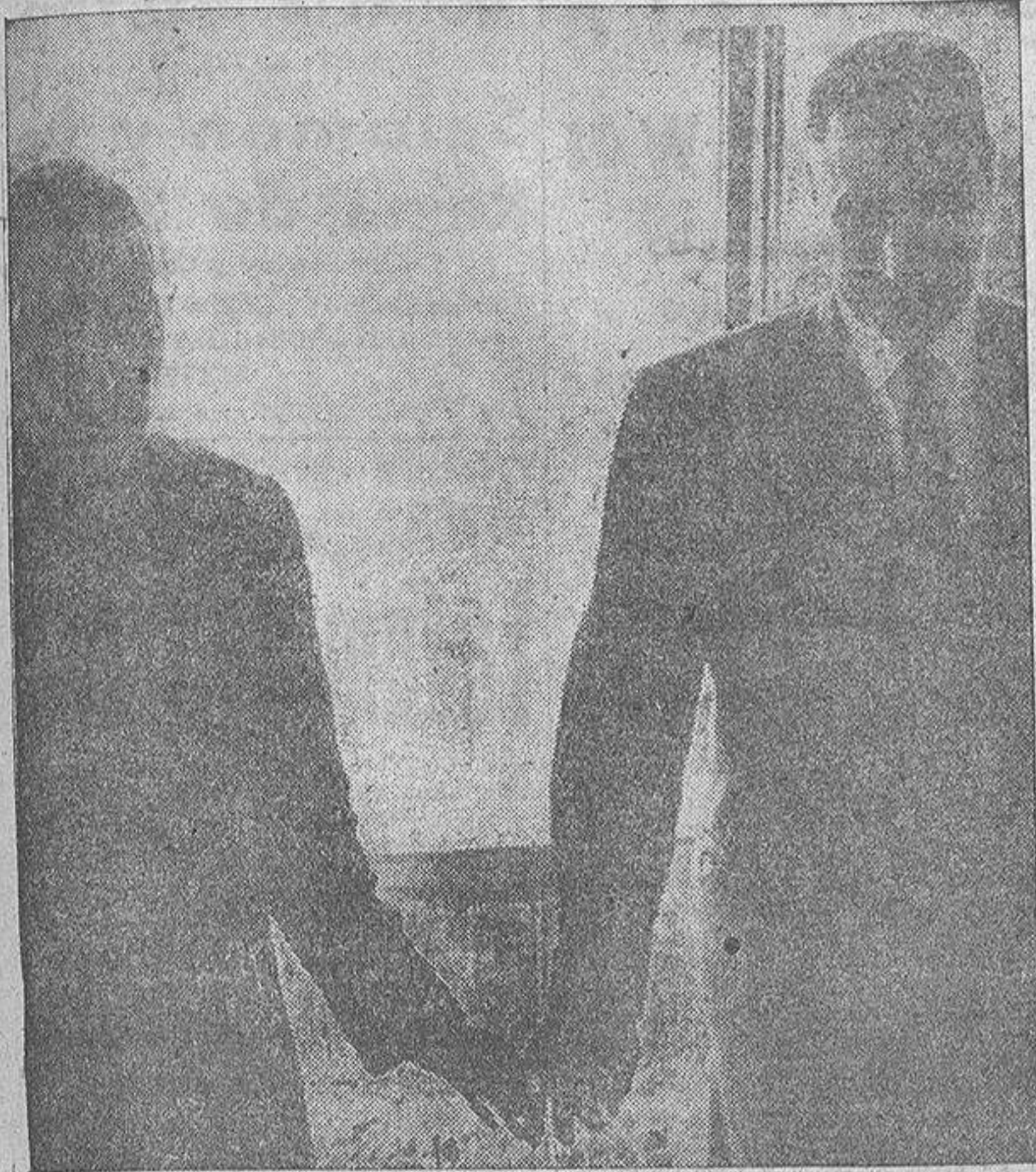
En el descanso de una de las sesiones de la O. N. U. celebradas en la última semana, un reportero gráfico captó esta curiosa fotografía en la que aparecen Nehru y Nasser cogidos de la mano como dos novios modernos. El gesto es de gran simpatía y acaso hayan querido significar con él la política "neutralista" de la que se han proclamado campeones

«Si atacaran a Cuba -dijo- podría significar su propia destrucción»