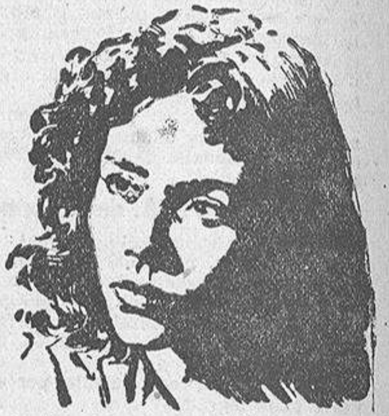
Jennifer Jones, en su magistral personaje de la mestiza de "Duelo al Sol"

Todo se centra en la rivalidad de dos hermanos, bondad e inteligencia uno; brutalidad, gallardía y tendencia a lo criminal, el otro, que pretenden, cada uno a su modo, el amor o favores de una muchacha mestiza acogida en su casa.