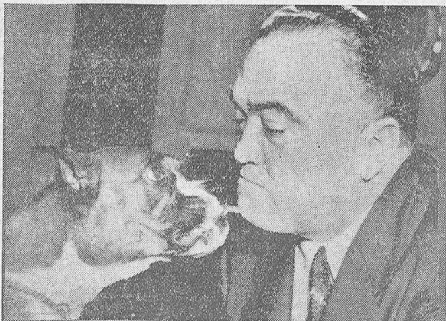
Edgar John Hoover, hermano del que fué Presidente de los Estados Unidos, es desde los años de la última guerra jefe del “FBI” norteamericano. que, como ustedes saben, son las iniciales con que se conoce al Cuerpo Federal de Investigación de Estados Unidos, que es una de las Policías mejor organizadas y eficaces del mundo. E. J. Hoover tiene un parecido extraordinario con un perro de presa, y le gusta retratarse frente a su can, como aparece en la fotografía.