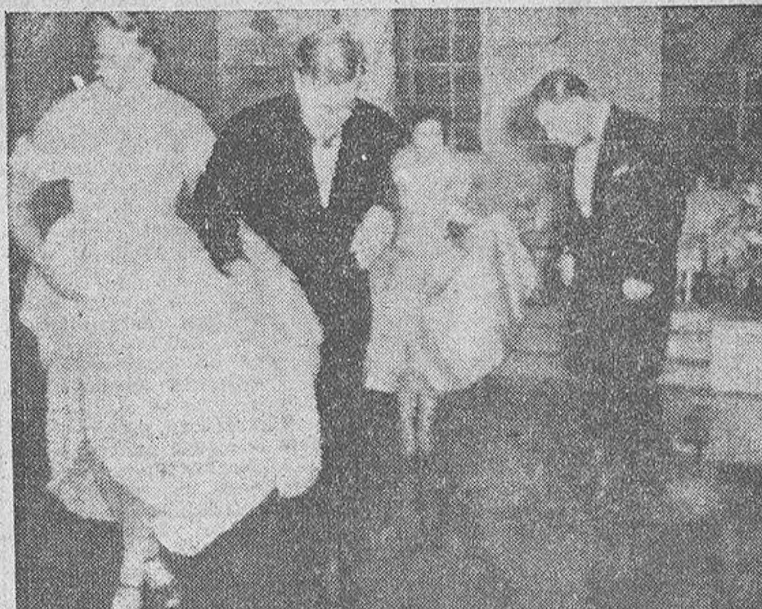
En Nicosia (Chipre), pocas horas después de haber decretado el nuevo Gobernador inglés el estado de guerra, los patriotas hicieron estallar una bomba debajo de la mesa que habitualmente ocupa la primera autoridad británica, en el baile tradicional del hotel Ledra-Palace. Hubo muchas víctimas entre los ingleses que asistían, y la explosión no alcanzó al Gobernador porque este se había retrasado en su llegada. La ruptura de cañerías producida por el artefacto inundó los salones. Aquí ven ustedes a algunos de los invitados supervivientes "vadeando" la pista de baile al abandonar el salón.