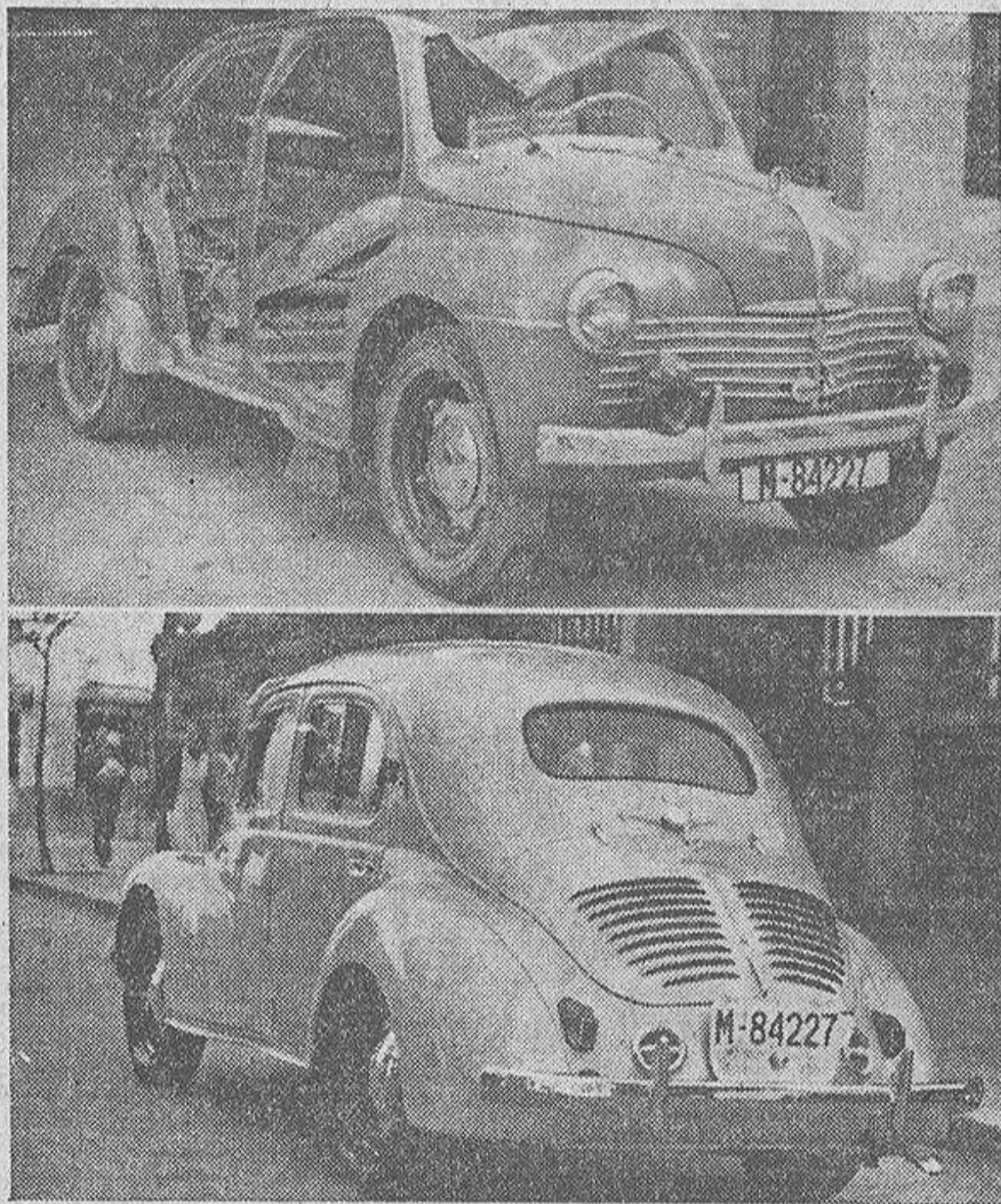
Este "cuatro-cuatro" de las fotografías está a nuestra vista después del accidente, en primer lugar, y tras la feliz reparación, en el segundo. La vista del automóvil en principio, hace dudar de que pueda volver a rodar por las carreteras.