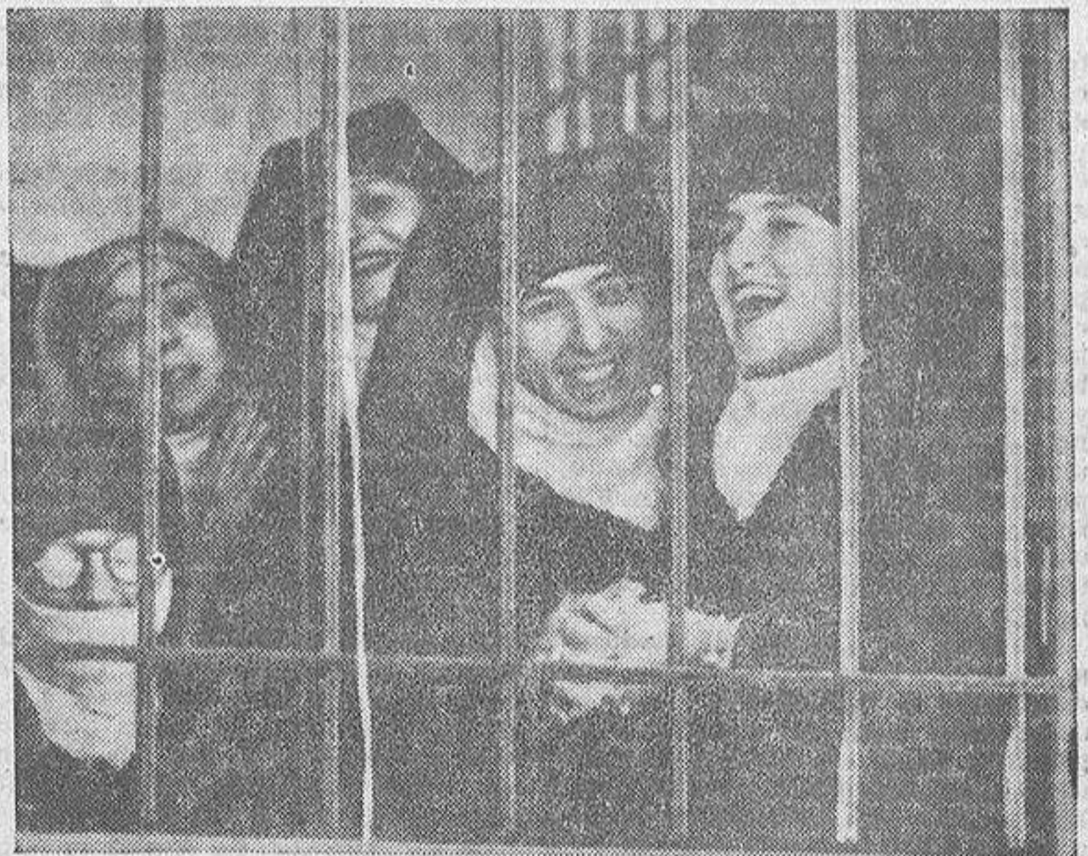
Mientras Mohamed V pronuncia el discurso de salutación a sus súbditos, al regreso de Rabat, en una ventana contigua del palacio imperial asoman, sonrientes, algunas de sus mujeres. Han sido sorprendidas a través de las rejas de su dorada prisión con los rostros descubiertos. Es, acaso, la primera fotografía periodística de las mujeres del Sullán sin velo