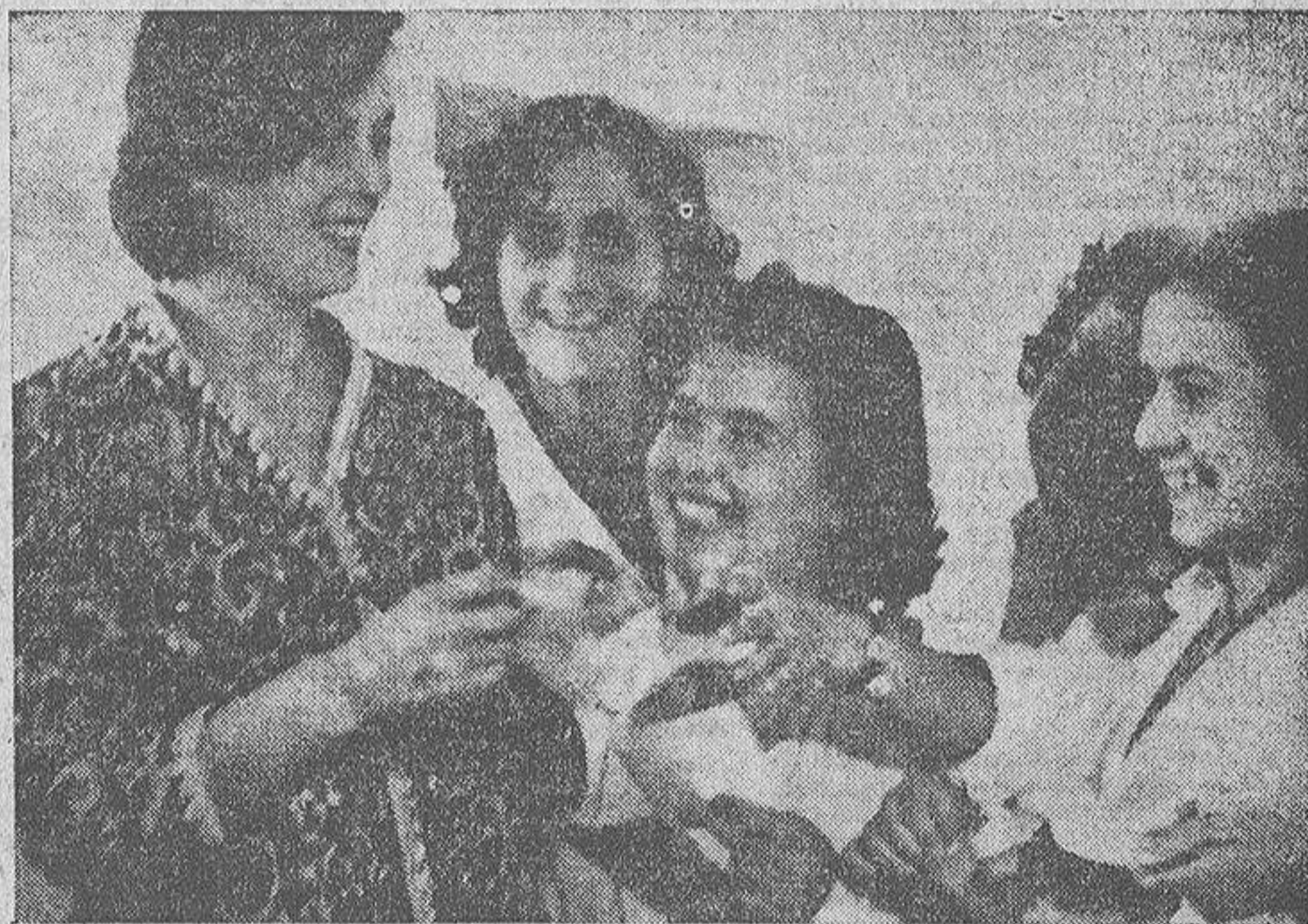
La esposa de Luis Miguel Dominguín, mientras espera un niño, se entretiene en firmar autógrafos en el taller de alta costura de Roma, a donde ha ido a encargarse un equipo adecuado a sus nuevas "responsabilidades".