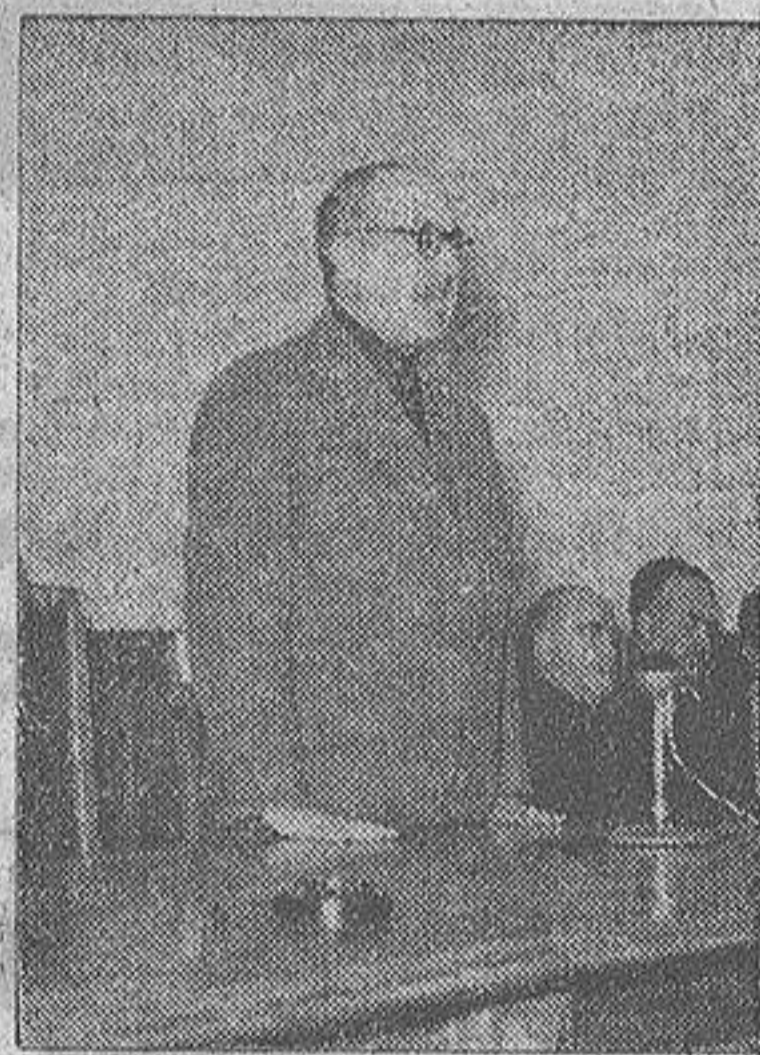
El Gobernador civil durante el discurso de clausura de la Asamblea Provincial del Movimiento

Las principales autoridades concurren al acto