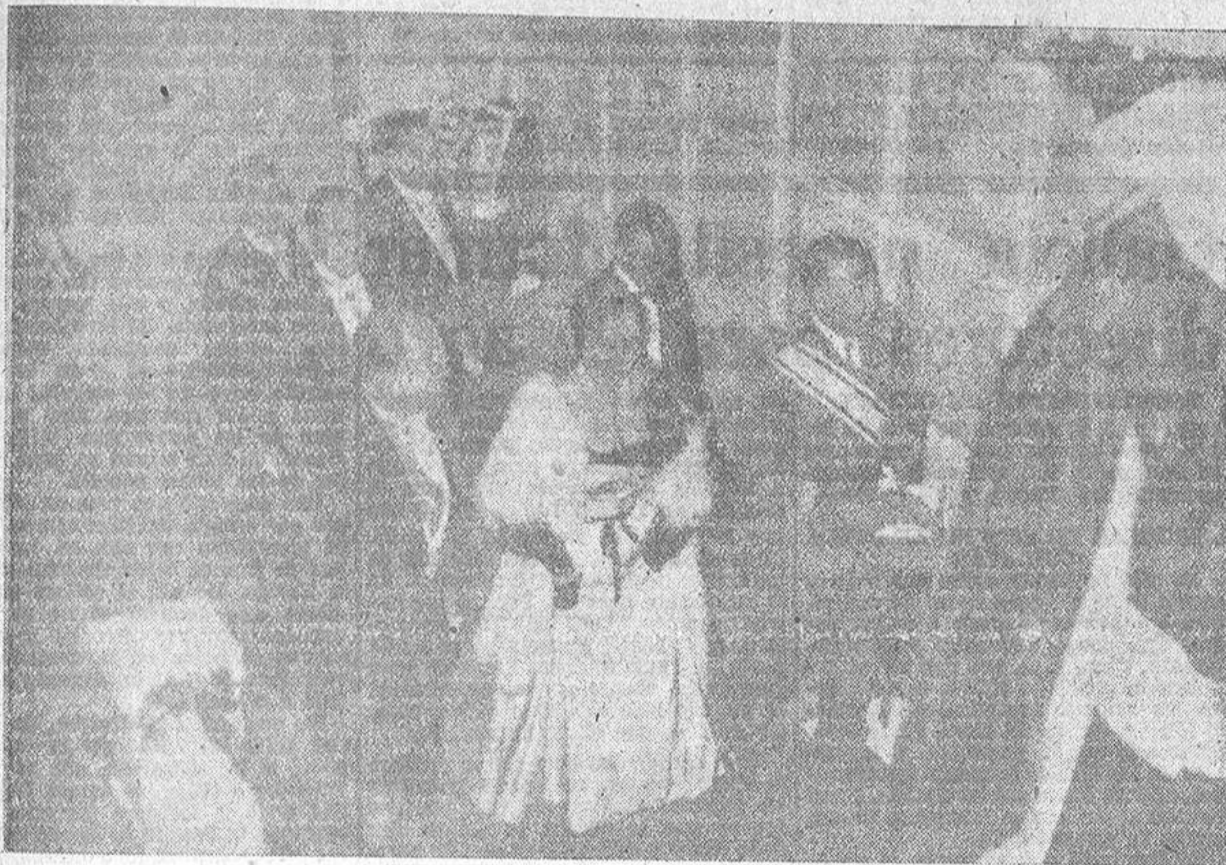
EL PALACIO MUNICIPAL FUE ESCENARIO EL SABADO ULTIMO DE UNA RECEPCION BRILLANTISIMA. CON MOTIVO DE LA CENA DE GALA OFRECIDA EN HONOR DE S. E. EL JEFE DEL ESTADO. EL CAUDILLO Y SU ESPOSA SUBEN POR LA ESCALERA DE HONOR DEL EDIFICIO PRECEDIDOS POR PORTADORES DE CANDELABROS Y MACEROS Y ACOMPAÑADOS POR LA CORPORACION MUNICIPAL

Acompañado de su familia, pasó el día a bordo del "Azor" El público que advirtió la presencia del Jefe del Estado le dispensó una cordial acogida