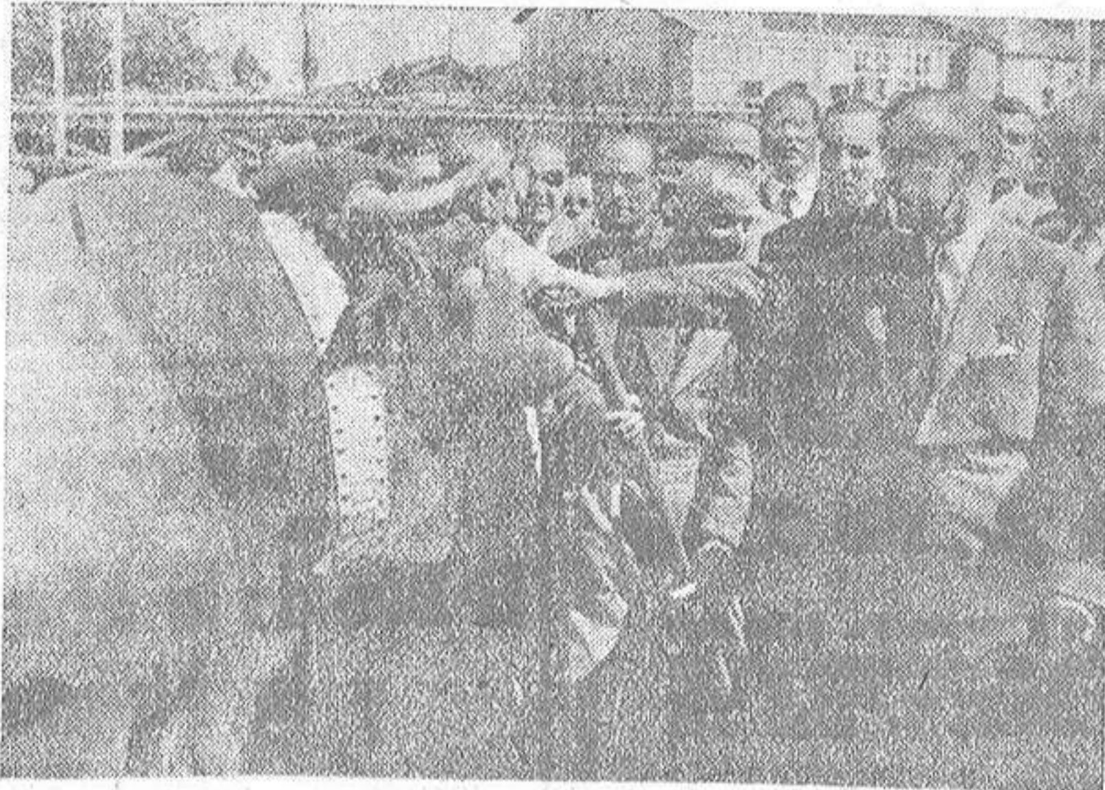
EL MINISTRO DE AGRICULTURA TOCA A UN HERMOSO EJEMPLAR DE TORO SEMENTAL QUE FIGURA EN EL CERTAMEN