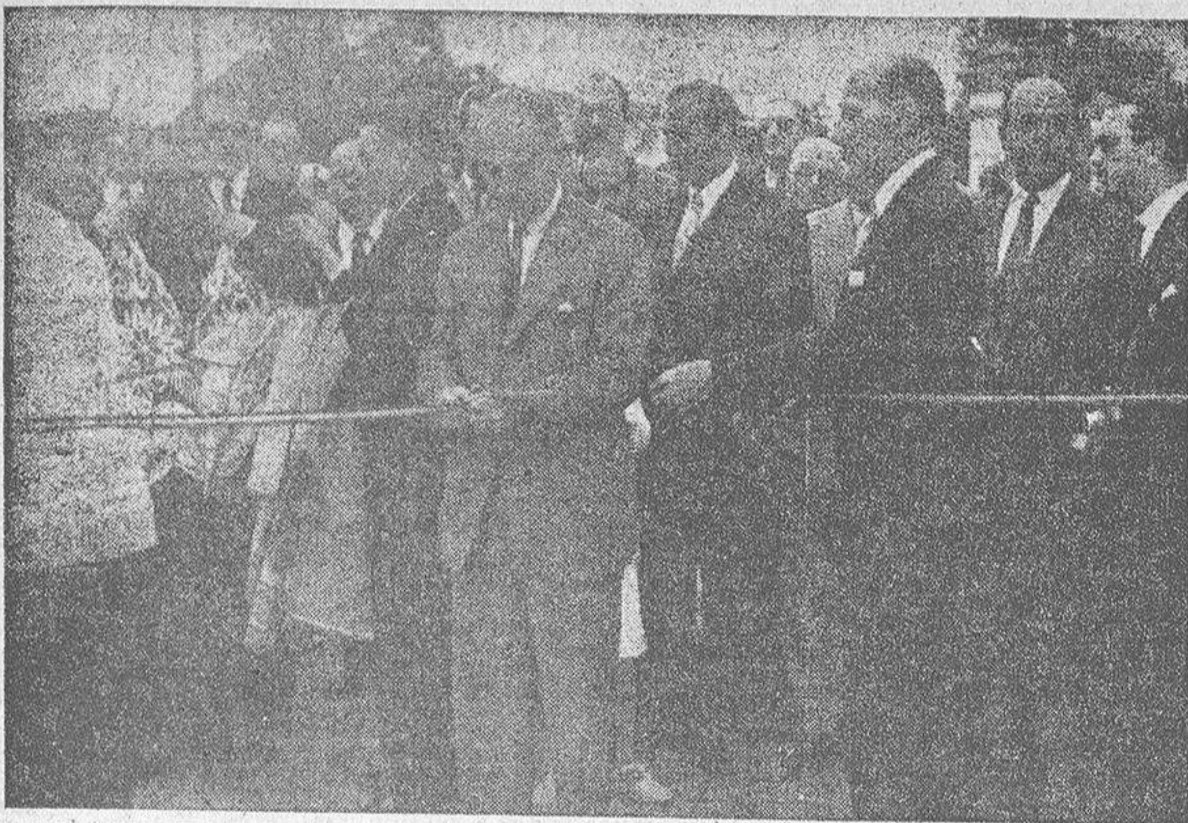
EL MINISTRO DE AGRICULTURA, SEÑOR CAVESTANY, EN EL MOMENTO DE CORTAR LA CINTA QUE CERREABA EL RECINTO, CON LO QUE SE DIO POR INAUGURADA LA EXPOSICION DE GANADO SELECTO