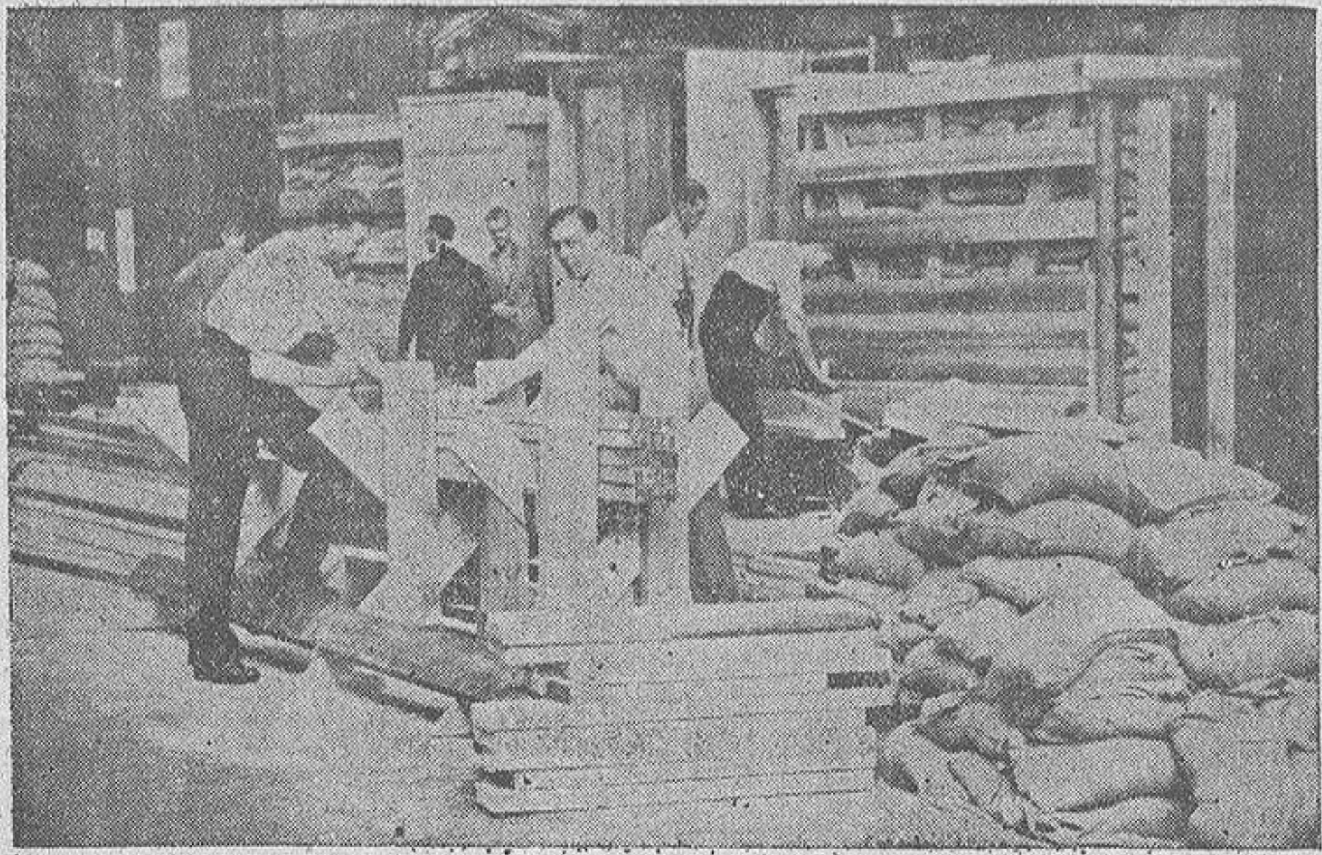
Gran número de edificios de Londres han sido protegidos contra los posibles bombardeos aéreos. He aquí los trabajos de protección de uno de los puestos de Policía de los barrios centrales de la capital