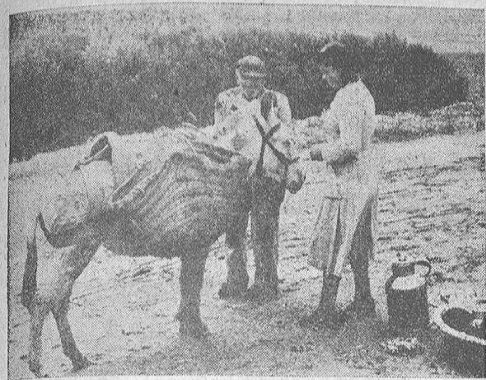
La lechera viene a recoger su burro y deja en manos del viejecito cuarenta céntimos, importe de sus honorarios por cuidárselo mientras ella distribuye su mercancía por la ciudad