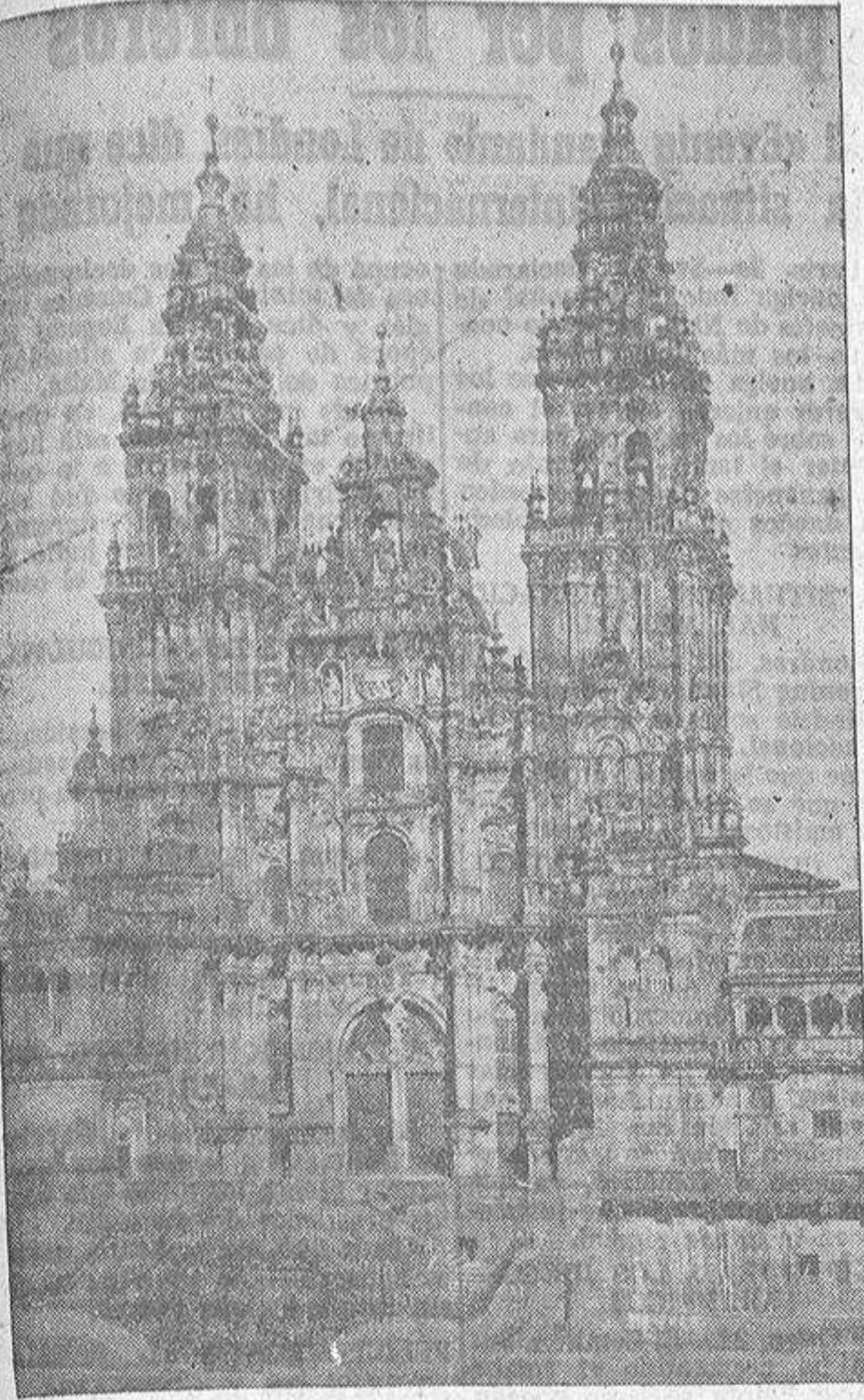
Fachada del Obradoiro de la Catedral compostelana y ante la cual será representado esta noche el Auto Sacramental "El Hospital de los locos"

(De su libro La tumba del Apóstol Santiago.)