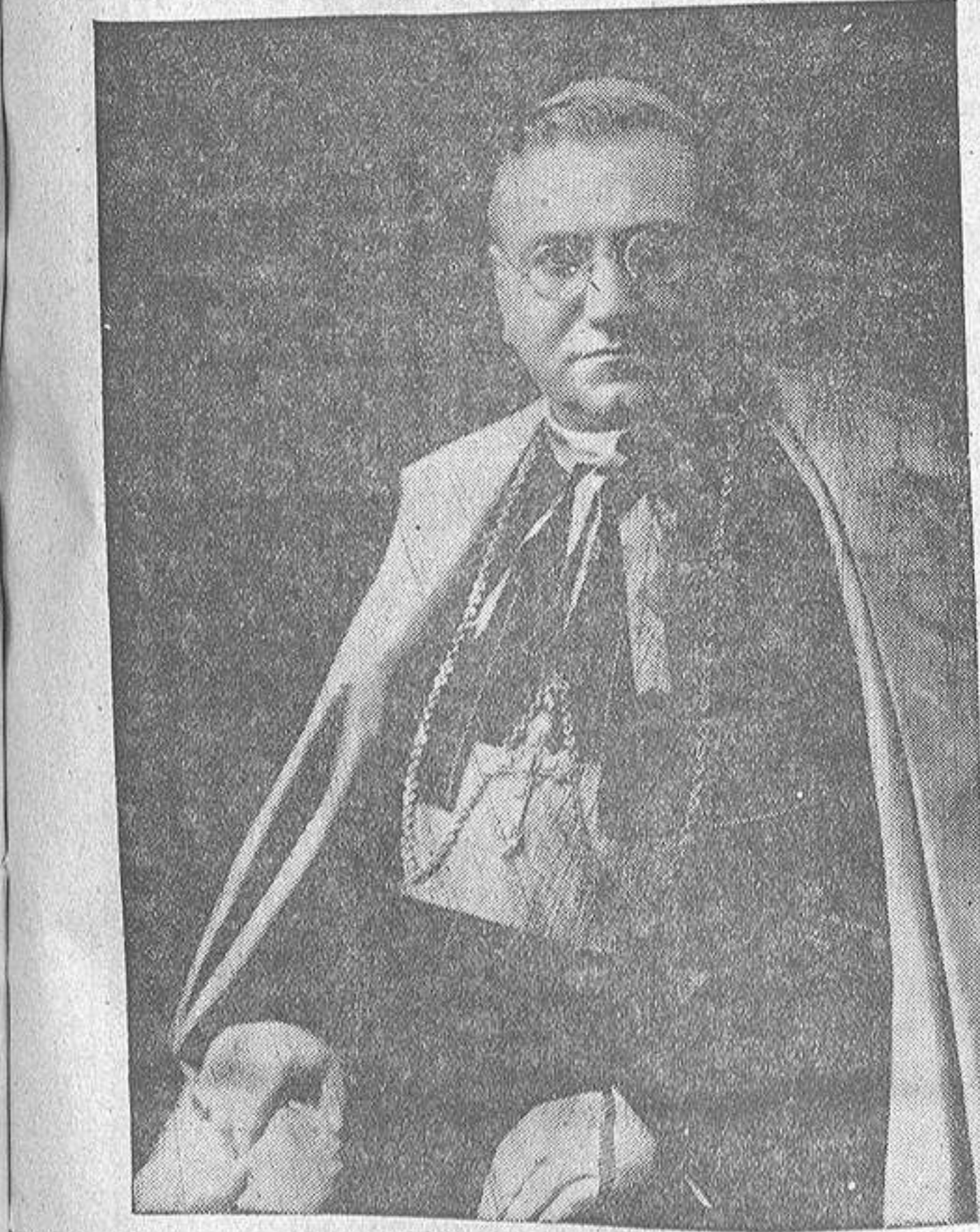
El Nuncio de Su Santidad, Monseñor Gaetano Cicognani, que oficiará de pontifical en la solemne Misa durante la cual será hecha la Ofrenda Nacional de España al Apóstol Santiago