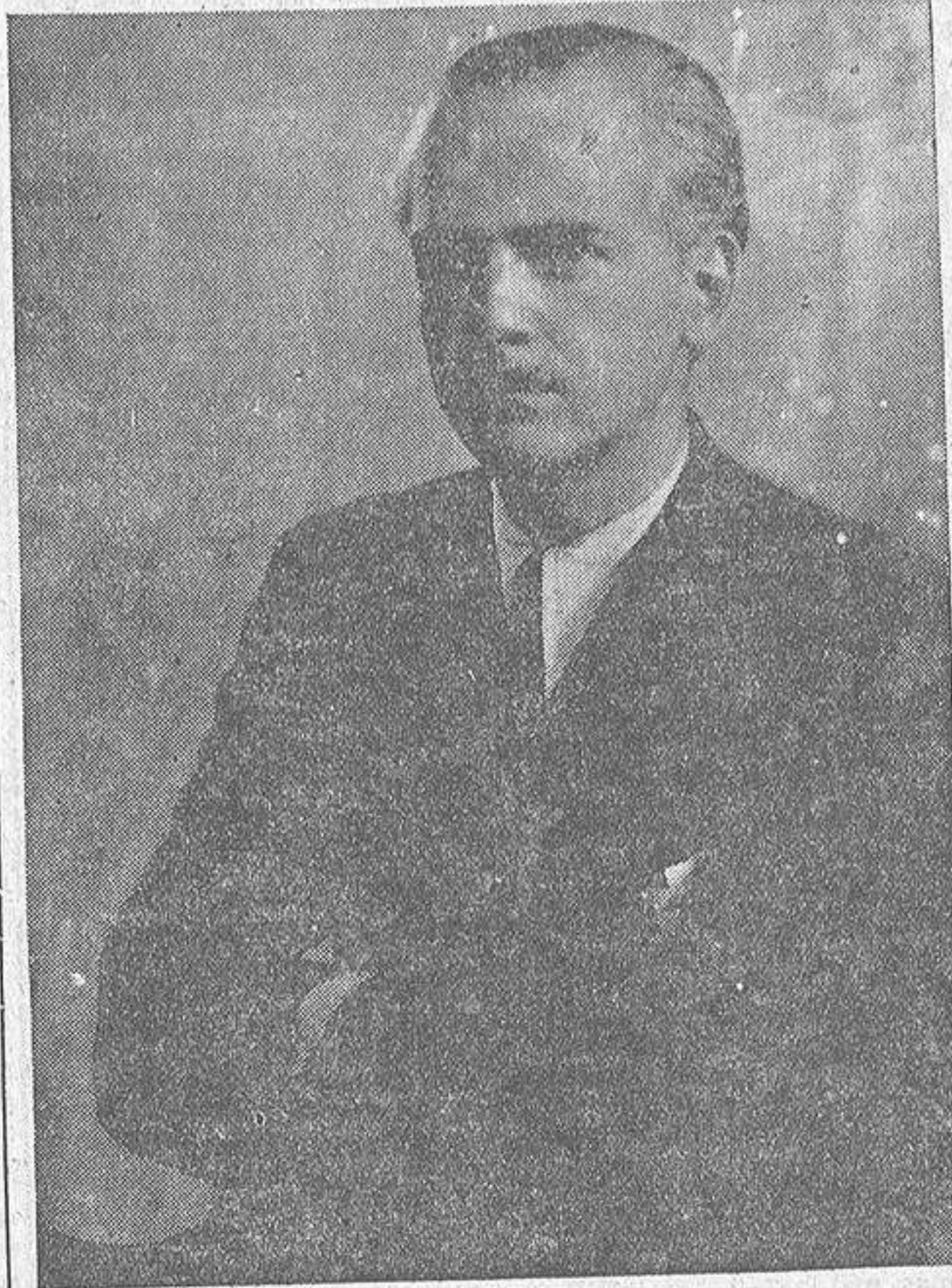
El Excmo Sr. Ministro del Interior, don Ramón Serrano Suñer, que, en nombre de S. E. el Jefe de Estado, hará hoy la tradicional ofrenda en la Basílica Compostelana