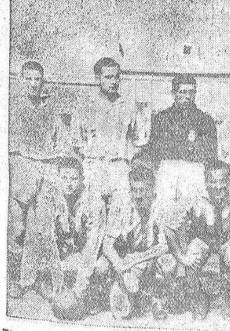
El equipo del Deportivo, que libró un magnífico encuentro frente al potente conjunto del Hungría.

Pero se llevaron un buen chasco. Porque "aquello" resultó un partido magnífico, emocionante, de fútbol muy superior al que nos ofrecieron el Lazio y el Atlético de Madrid. Y el once