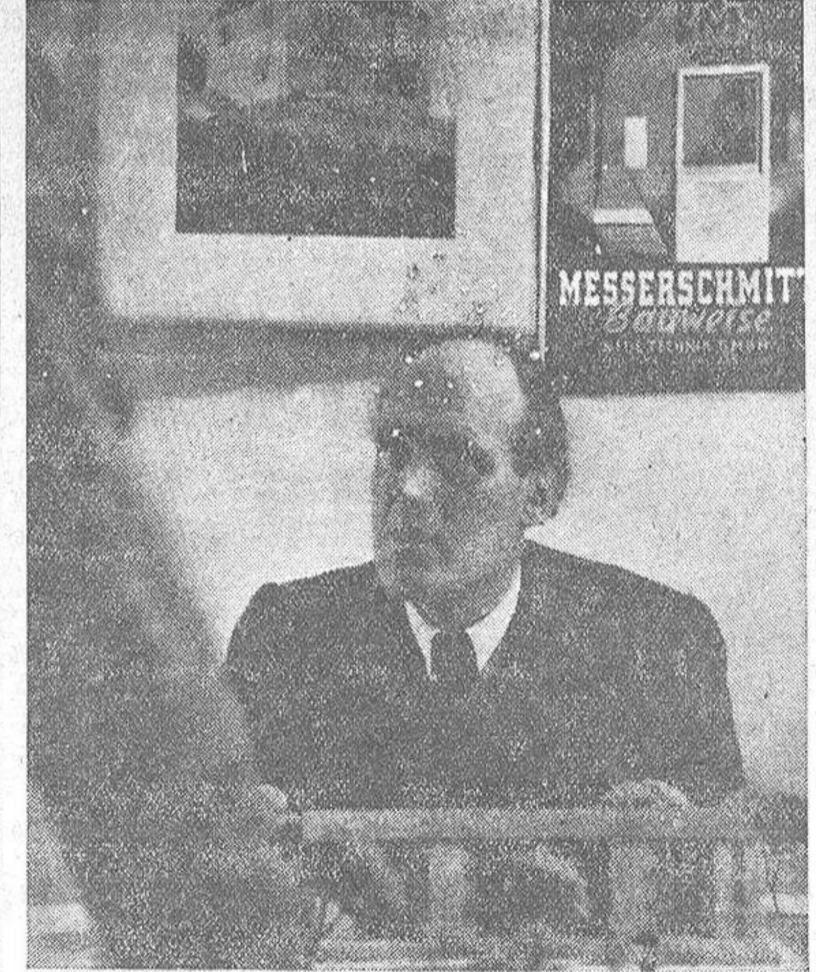
Willy Messerschmitt, el que fué gran constructor de aviones del Reich, es hoy un pacífico comerciante de casas prefabricadas