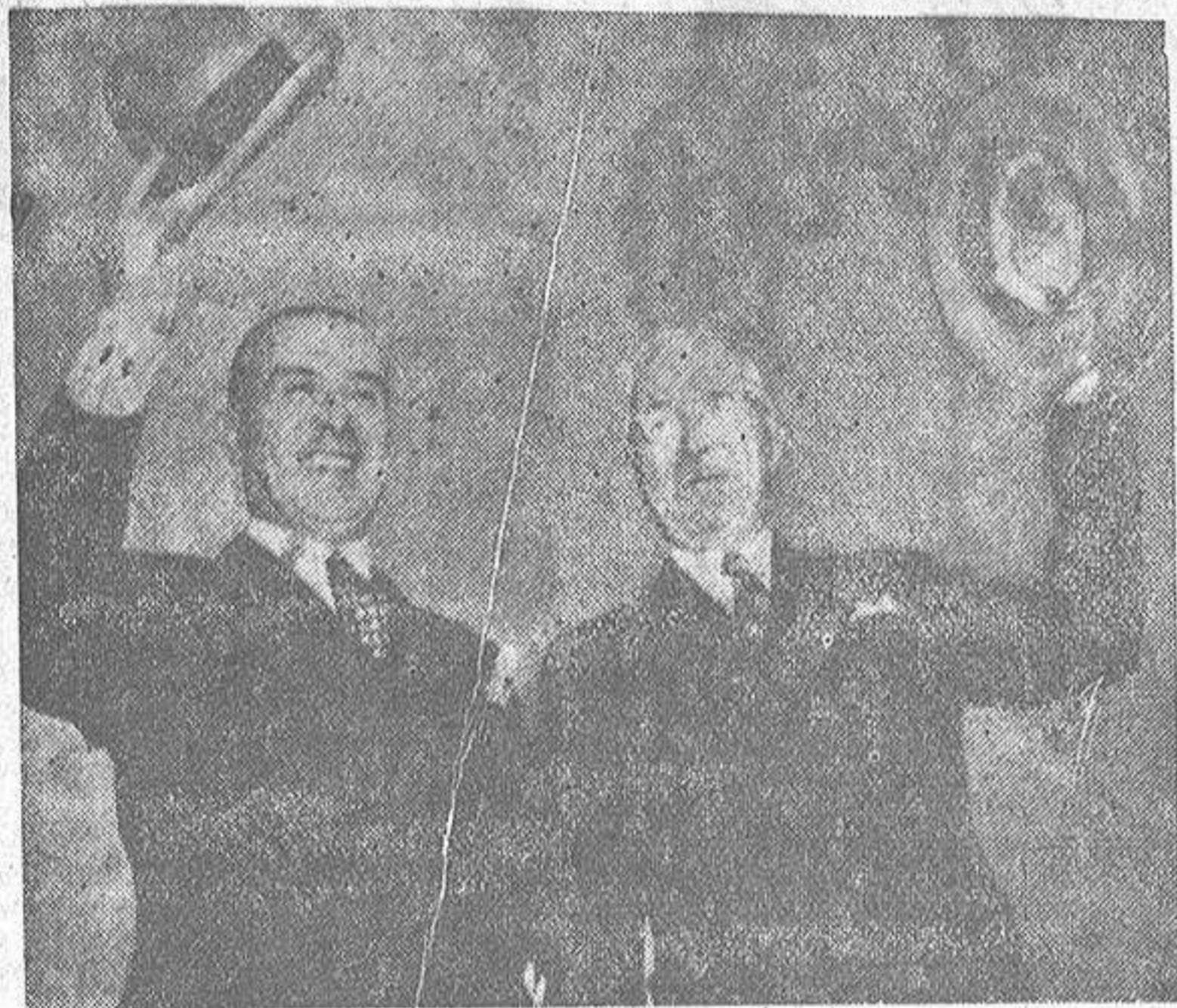
El Presidente de la República de Chile, Gabriel González Videla, acompañado de Truman, saluda al público que acudió a esperarlo, a su llegada a Washington