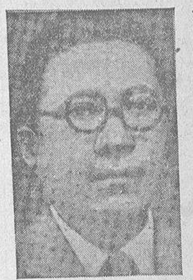
EL GENERAL YANG HOU comandante de la guarnición de Shanghai, hasta el momento de la retirada china, ha sido ejecutado por orden del general Tehang Kai Chek, acusado de corrupción y de desobediencia.

Segovia.—Se descubrieron las lápidas que dan el nombre del Generalísimo Franco a una plaza y los de Calvo Sotelo, Mola y José Antonio a las tres principales calles de la ciudad. El acto se celebró dentro del mayor entusiasmo, procediéndose en primer lugar a oír una misa y después a descubrir las lápidas a los acordes del Himno Nacional, ejecutándose también el himno "Cara al Sol", ante la que lleva el nombre de José Antonio. Desde el balcón del Ayuntamiento dirigió la palabra el alcalde a la muchedumbre congregada exaltando la labor realizada por los hombres cuyos nombres quedarán allí grabados. Terminó la ceremonia interponiéndose otra vez los himnos.