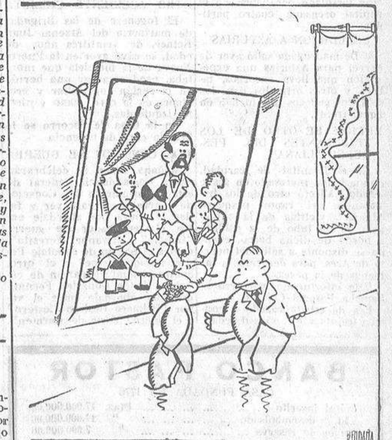
EL CRITICO Y EL NUEVO RICO