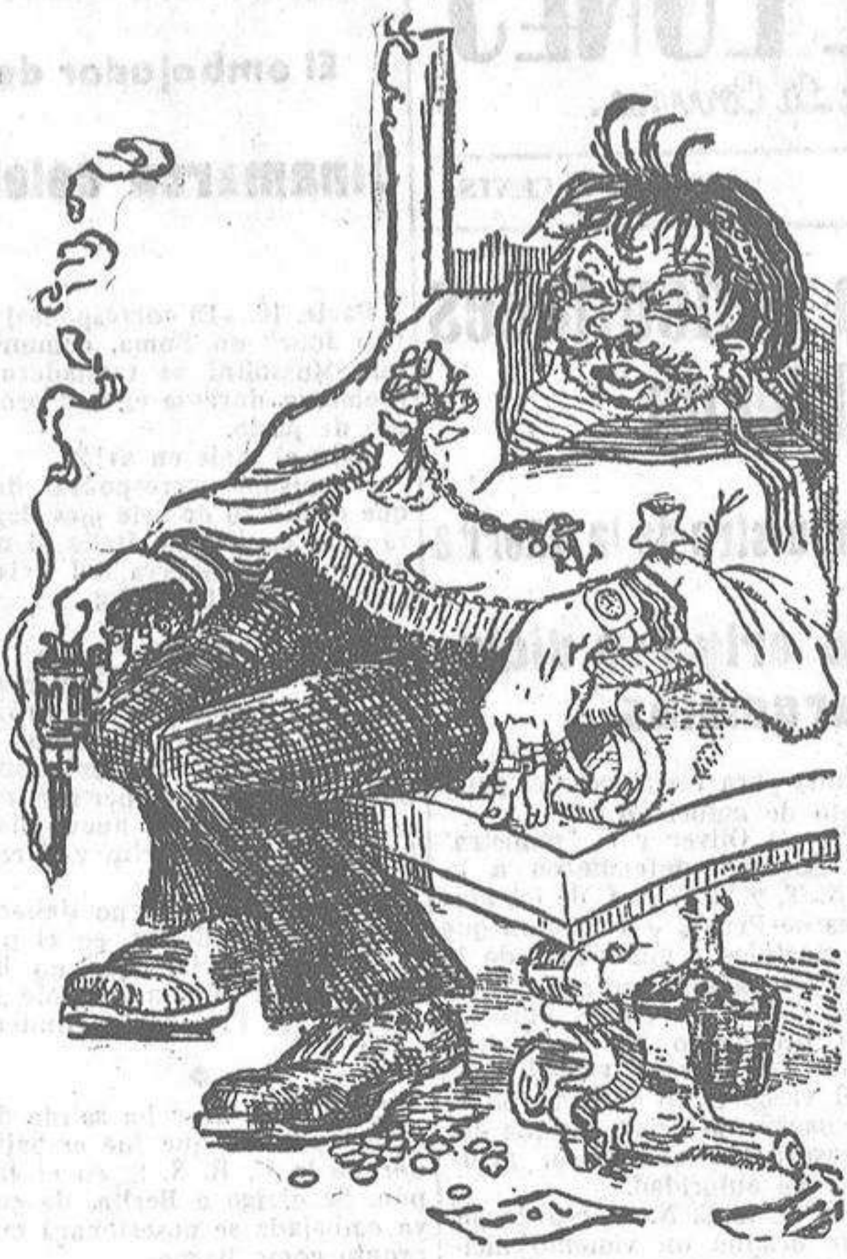
Presentamos a nuestros lectores al tipo que encarna el orgullo y la belleza de la revolución moscovita. Su poder de fascinación es grande, pero cuando sus encantos naturales no son bastantes para cautivar a la blanca paloma en la que puso sus ojos, apela al argumento convincente del revólver. Ni una se le resiste.

(Exclusiva para la HOJA OFICIAL de La Coruña)