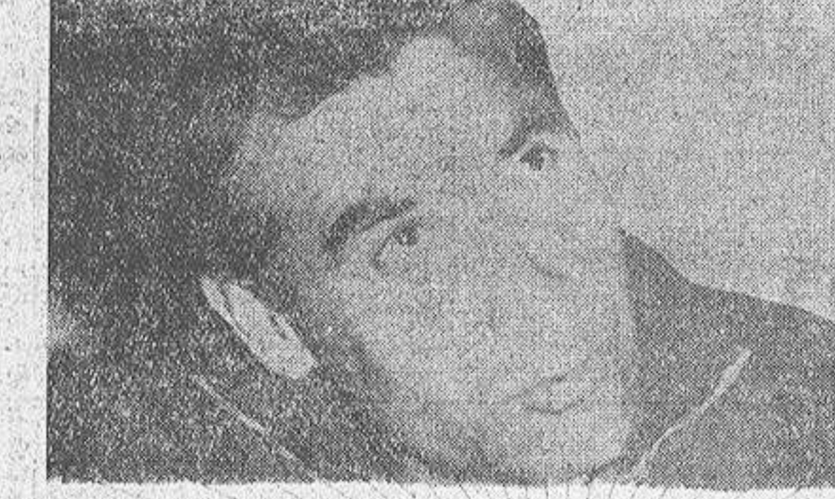
ARSENIO, continuará al frente del equipo del Deportivo, como entrenador, por lo cual ya prorrogó su contrato.

Esta es la época en que los Clubs empiezan a "tender sus redes" pa-