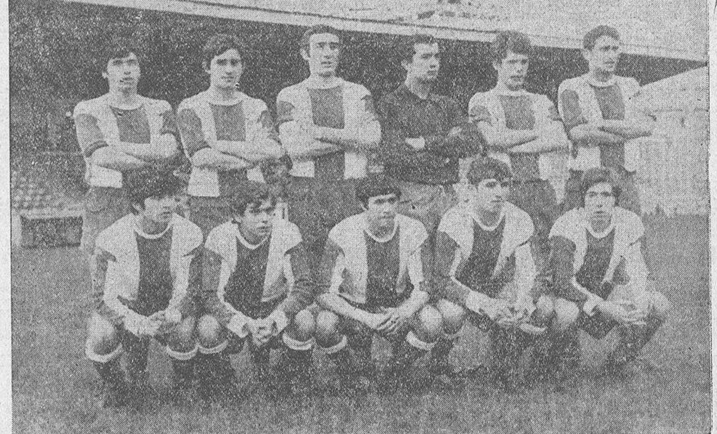
Equipo del Fabril, que después de una brillante campaña, ha conseguido el ascenso a Tercera División, categoría en la que ya militó en anteriores temporadas