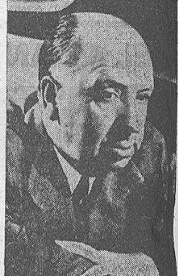
Alfred Hitchcock, el famoso director del que se proyecta estos días una película que hizo en 1947

EL Alfred Hitchcock de hace veinticuatro años, no es el Alfred Hitchcock actual. Lógicamente, el paso del tiempo ha madurado su profesionalidad y le ha convertido en el maestro del "suspense". Pero ya en 1941 demostraba sus dotes de director y para muestra vale "El proceso Paradine", que vista ahora con tanto retraso, nos parece una película morosa y de relativo interés. Ocurrir simplemente que la buena técnica de Hitchcock está plenamente superada por el tiempo, y el aficionado de su realización queda reducido al trabajo de un cuadro de intérpretes que juegan —y algunos son— figuras del cine mundial, como Charles Laughton, Gregory Peck, Ethel Barrymore, Aida Vail, Louis Jourdan, etcétera.