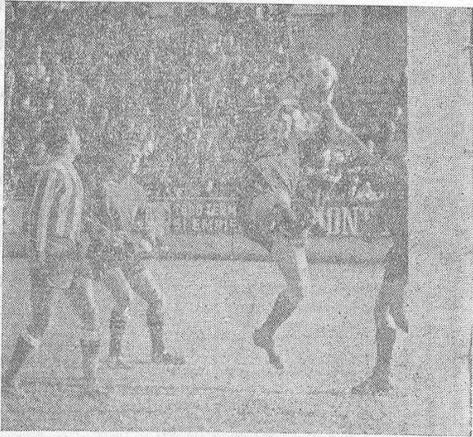
Con dificultades, logra el guardameta murciano hacerse con el balón, en uno de los frecuentes momentos de acoso de la delantera blanquiazul

Ganará Vd. cultivando champiñones en su propia casa. Negocio cómodo y de gran porvenir. Compramos producción. Solicite información PRODUCTOS ALBA, Enamorados, 23, Barcelona, 12.