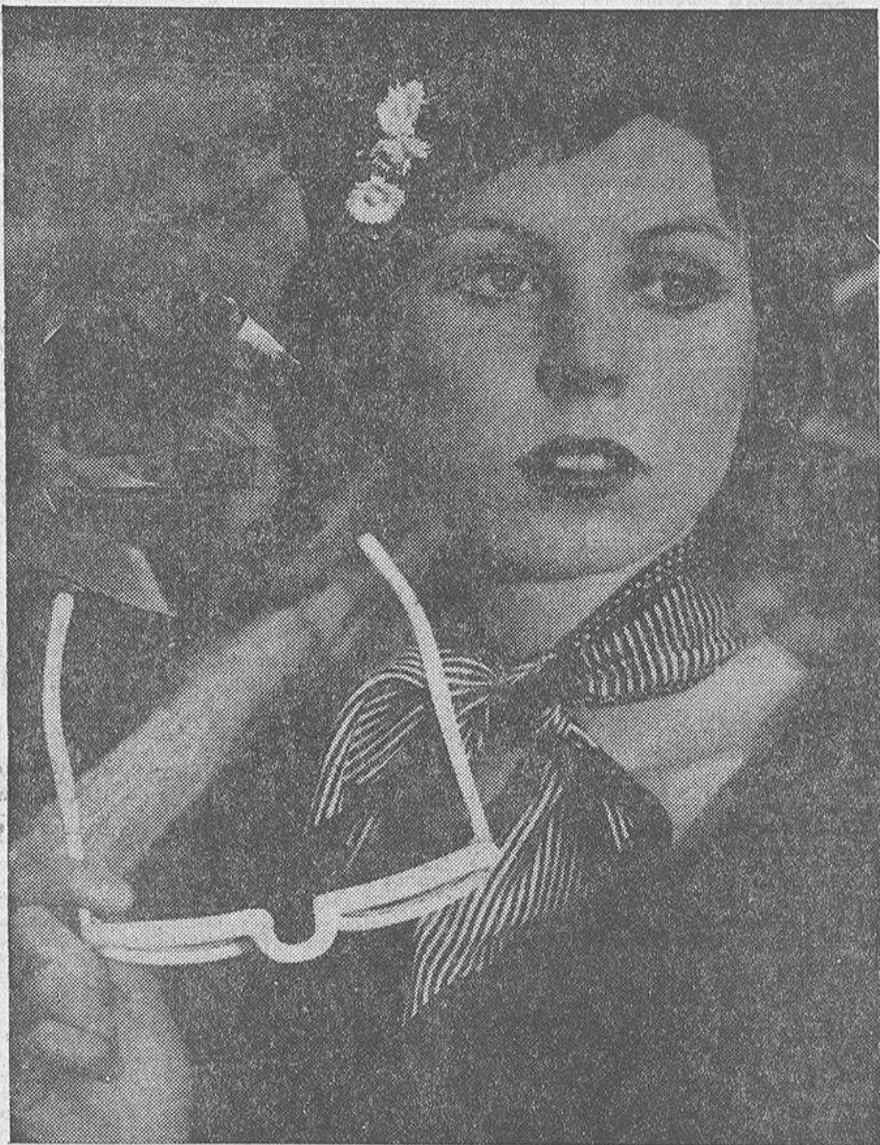
Hace algunos años, las mujeres que padecían algún defecto en la vista, procuraban disimularlo. Casi todas tenían alergia a las gafas. Ahora, por el contrario, se sirven de los lentes no sólo las muchachas miopes, sino aquellas que pretenden llamar la atención. Así es como la industria óptica ha encontrado una nueva salida para sus productos. Y así es como en sus propagandas indica que unas gafas bellas son un arma eficaz de seducción para Eva

A la vez que empeora la calidad de los quesos, se incrementa el consumo de fruta