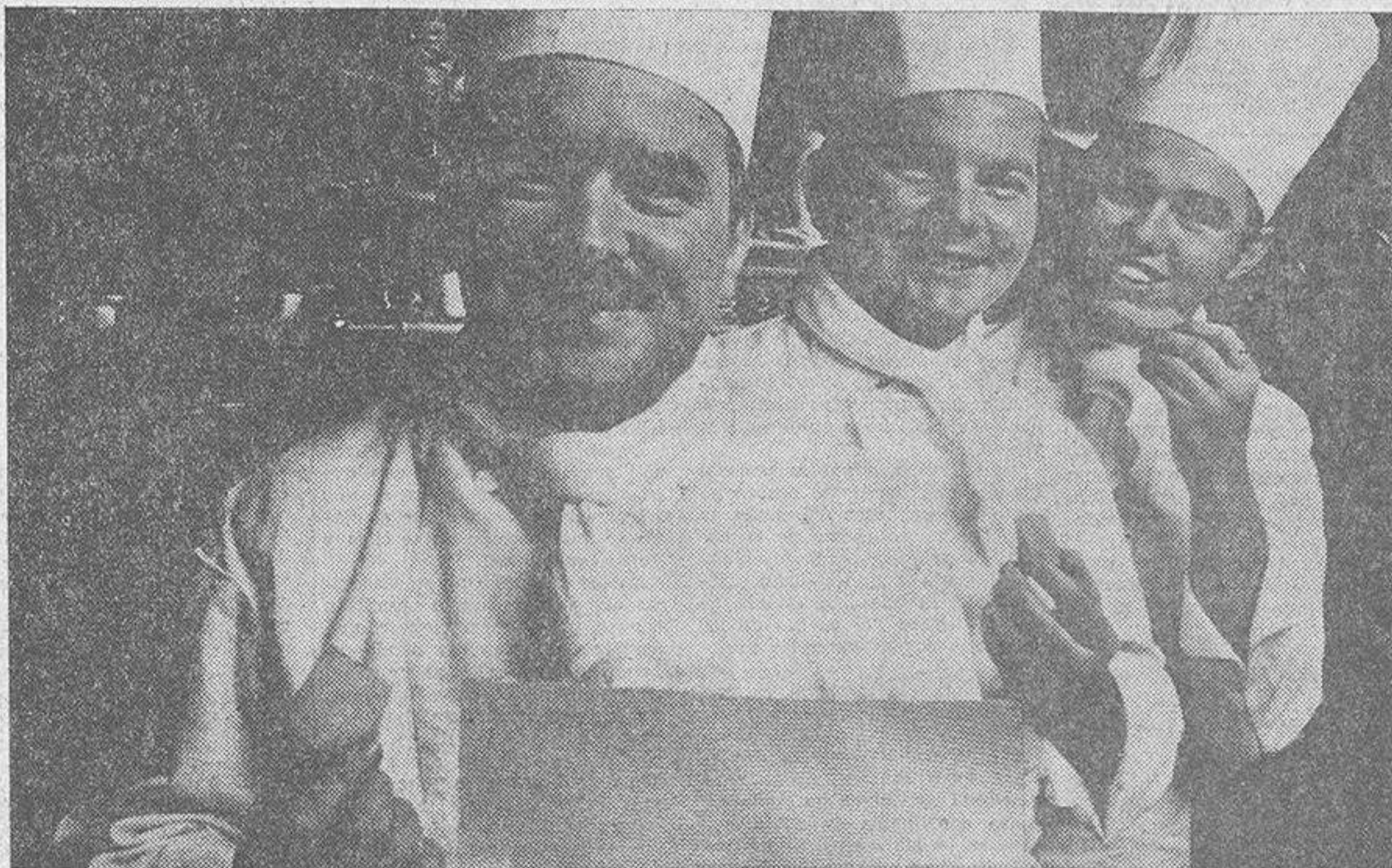
Desciende en Europa el consumo de quesos. Sobre todo, en Holanda, donde el famoso "bola" parece haber perdido calidad desde la constitución de grandes cooperativas que empeoraron el producto. Todo ello, a pesar de anuncios tan sugestivos como el que reproducimos. Sin embargo, conforme desciende la afición por este artículo aumenta la de la fruta, que en los pueblos prósperos se consume en cantidades masivas

La explicación a este fenómeno reside en que, como se consumen comidas de muchas calorías, la gente recurre a la fruta