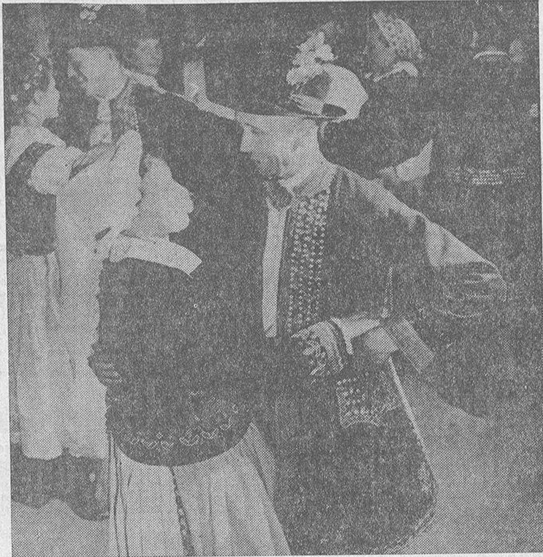
Costumbres ancestrales imponen en muchos países determinadas ceremonias y ritos que en algunos aspectos resultan divertidos pero que complican el ceremonial de la boda.

En Grecia han de tirar una granada contra el dintel de la puerta En muchas regiones de Rusia cierran puertas y ventanas... para evitar que entren las brujas