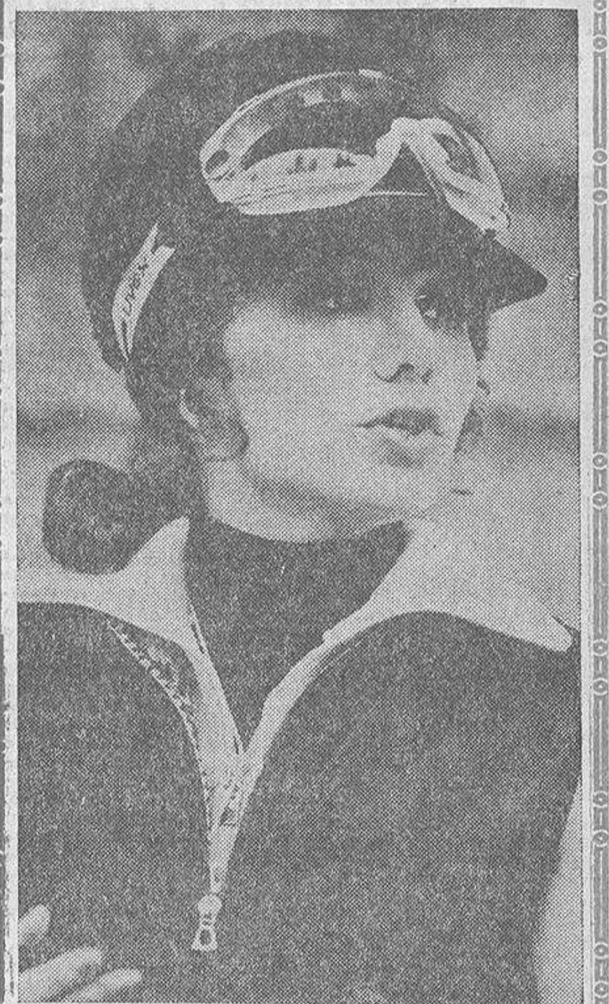
Farah Diba, fotografiada en Saint Moritz, donde pasa una temporada para practicar los deportes de invierno, de los que es una entusiasta. Por cierto que la estancia en Suiza de la familia imperial persa ha aparecido turbada por el accidente ocurrido al primogénito, Reza Ciró, heredero del Trono del Paso Real, que en una caída se ha fracturado la tibia. Reza Ciró, que cuenta once años de edad, ha tenido que renunciar a la práctica del esquí, del que, lo mismo que sus padres, es un gran aficionado. Por cierto que el Sha, a su llegada a Saint Moritz, contrajo una gripe de tipo Hong-Kong. Farah Diba se ha visto obligada, pues, a interrumpir sus vacaciones para actuar como enfermera de su esposo y de su hijo.