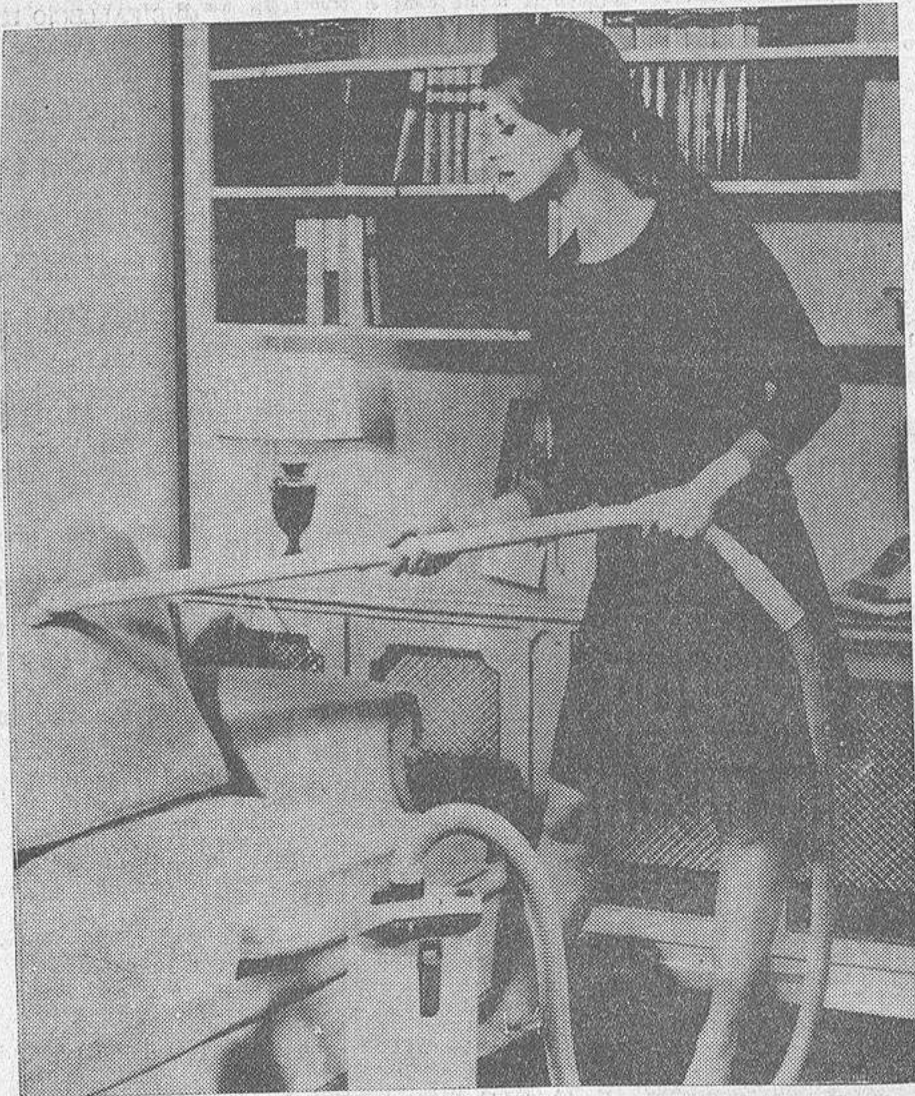
Según los científicos, la mejor forma de abordar las tediosas tareas del hogar, sin olvidarse de la mitad, consiste en so meteterlas a un orden preciso e invariable.

Hasta tal punto que, en beneficio de las amas de casa que suelen escuchar los boletines informativos durante el día, los directivos de las diferentes emisoras de radio de Australia han encargado a los redactores