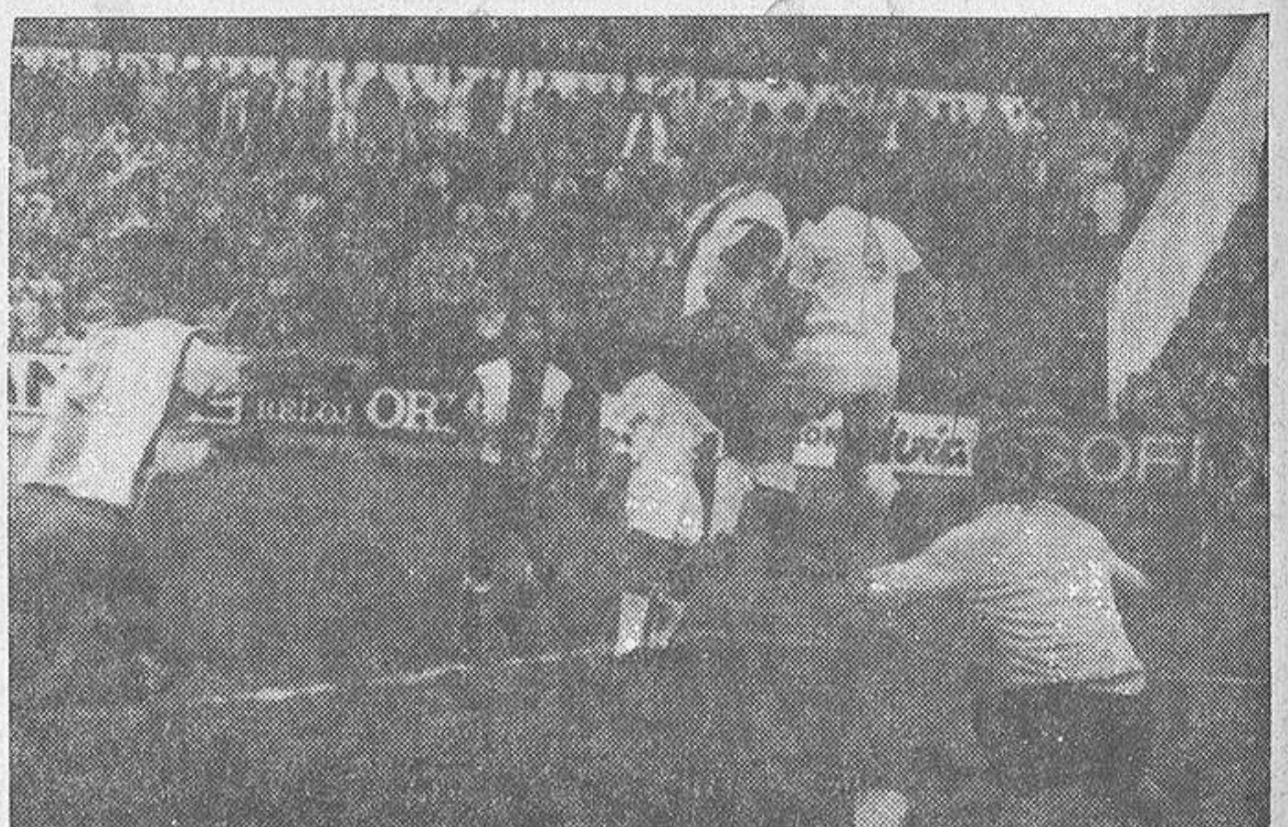
Esta imagen, de Quián, da una muestra bastante cabal de lo que fue el partido. Acoso insistente de nuestros blanquiazules, recia defensiva de los malagueños, balones por el aire, en busca de una cabeza oportuna, que esta vez no hubo, los en el área, etcétera. Un partido entretenido, eso sí, pero con mal sabor de boca por el resultado, que no refleja los méritos del cuadro de casa.

VESTUARIO MALAGUEÑO Ha finalizado el partido entre los gritos de la multitud que dirigió una larga serie de improperios, no todos sacados del diccionario castellano, y algunos dignos de amplio estudio por los académicos. El señor Canera, muy "entero", se dirige a su vestuario. ¡Lo que se tiene que oír por ver! ¡Una "afición" que no nos vale! Nosotros nos dirigimos al vestuario del malagueño. Queremos oír las impresiones que sobre lo desarrollado en Riazor ha obtenido el señor Kalmar. Este nos recibe muy serio y tranquilo. Carraspea ligeramente. —Buenas tardes, señor Kalmar. ¿Qué hubo en el partido de hoy? —Nada. El Coruña atacó mucho