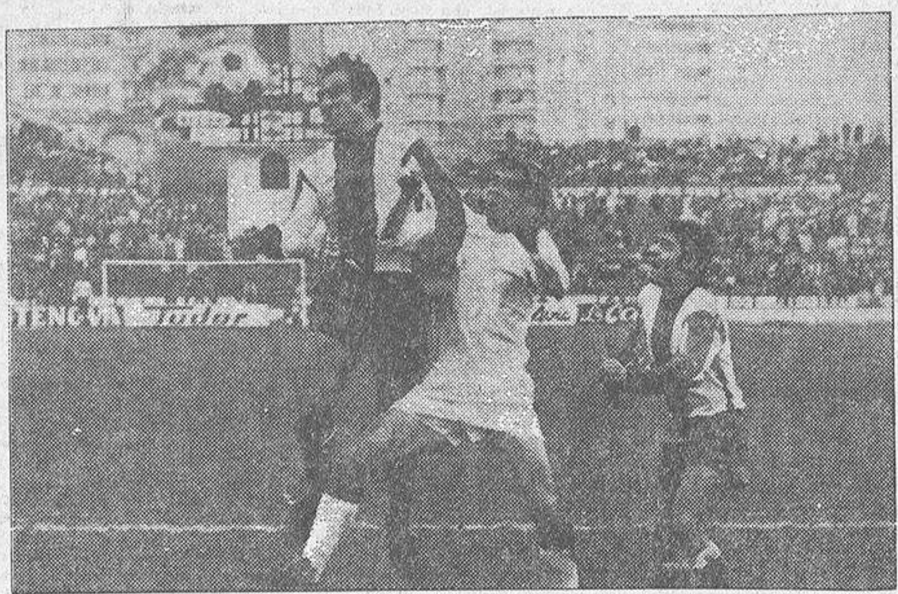
Manolete, como siempre, intentó el remate de cabeza. En la primera parte, el travesaño malagueño usó de sus cabezas con olor a gol. En el segundo tiempo, el medio blanquiazul anduvo también por los sitios de peligro, aunque esta vez, como se aprecia en el grabado, de Quián, resulta frenado por la mano y pierna derechas que un defensor malagueño emplea ante la segura pasividad del "tren-cita".

nera sufriendo constantes equivocaciones, toda vez que en cuanto el juego discurría por el centro del campo su silbato señalaba todas las faltas con acierto. No, y esto hay que decirlo muy alto, el colegiado manó dio la impresión de salir al campo dispuesto a que el Deportivo, pese a merecerla desde el principio al fin del partido, no se alzase con la victoria. Ya en el primer tiempo tuvo errores en contra de los blanquiazules que provocaron las protestas de los espectadores. En la segunda parte la cosa fue desastrosa. Primeramente anuló un gol a Cobas en el que no cabe el fuera de juego, porque su disparo al ejecutar un golpe franco, rebotó en la barrera y en el acto fue nuevamente disparado hasta las redes con su descubrimiento y con su temor a sacar a algún otro de los delanteros de que dispone. ¡Dichoso conservadurismo! Y error muy grave, también —aunque Arsenio pueda decirnos que es el mismo en que inciden otros prestigiosos entrenadores, y entre ellos el seleccionador nacional— es el que el equipo juega en Riazor, frente a enemigos totalmente reflejados, sin interiores. Eso, dígame quien lo diga y disponga quien lo disponga, es un disparate táctico mayúsculo. Conoce el crítico de memoria lo que se le argüirá, respecto al desdoblamiento de los laterales y de algún otro jugador que no es delantero. Pero todo ello no es más que vano bizantismo, ante el hecho real de