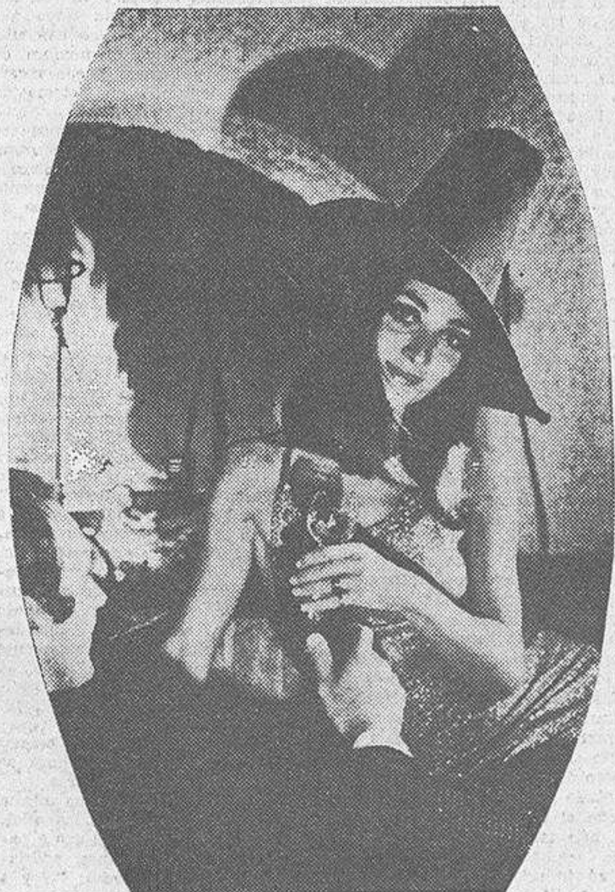
Aun cuando el alcoholismo incrementa cada vez sus estragos en los países de la Europa próspera, lo cierto es que el mayor porcentaje de alcohólico lo dan las personas adultas. Los chicos, por el contrario, suelen beber refrescos, aun cuando encuentren en la droga un camino mucho más peligroso

Los ingleses, por el contrario, hace tiempo que cubrieron sus vacíos laborales dedicándose a diversas aficiones. Tal es lo que ocurre con la caza y con la pesca, dos de las grandes aficiones de los británicos del Norte. Y no hablemos ya de la cacería del zorro, uno de los espectáculos más sangüarios que se conocen. Superior en crueldad, sin duda alguna, a nuestras tan denostadas corridas de toros. Pero donde el británico parece encontrar un placer, se encuentra a sí mismo, en la pesca