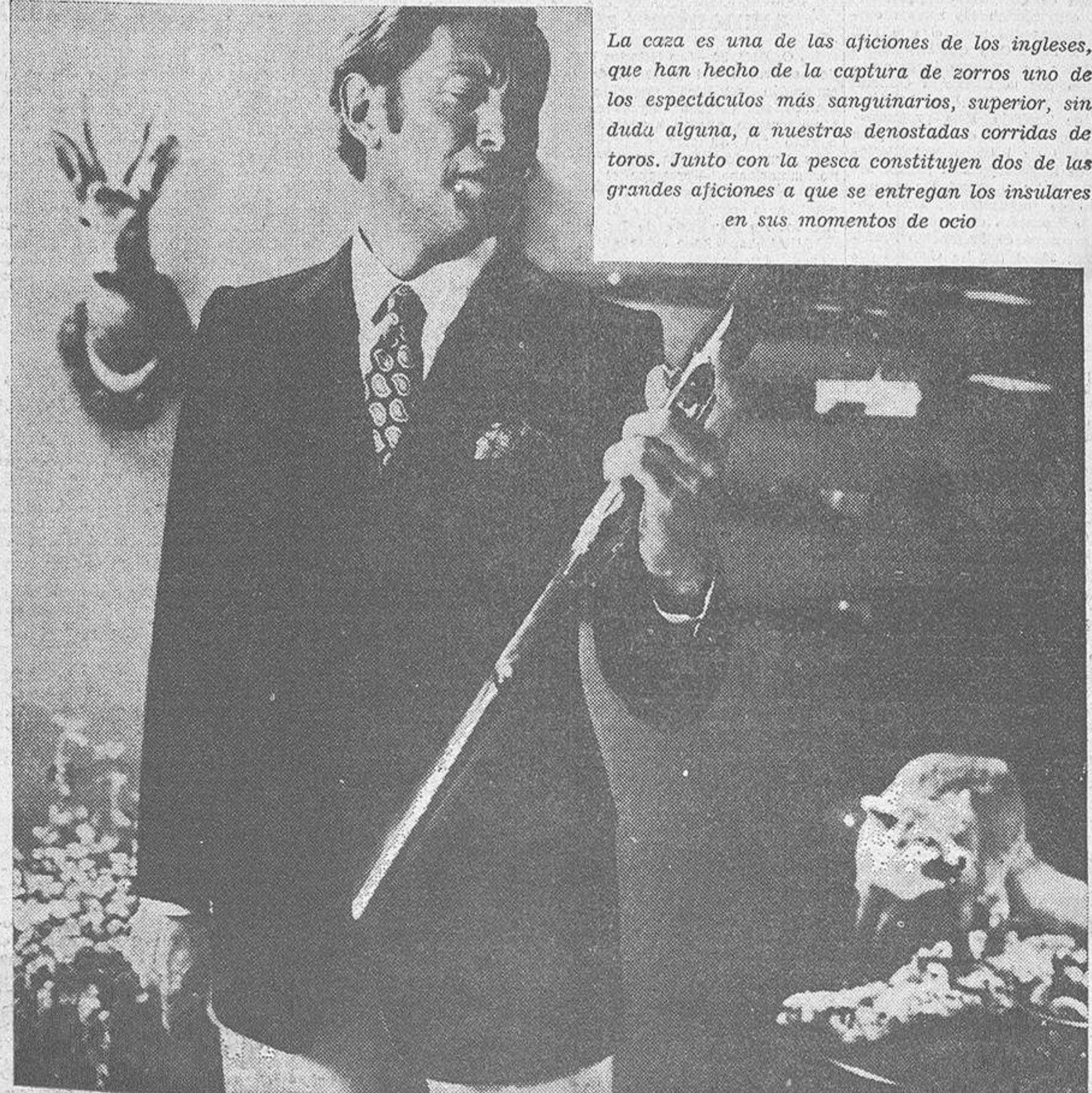
La caza es una de las aficiones de los ingleses, que han hecho de la captura de zorros uno de los espectáculos más sangüarios, superior, sin duda alguna, a nuestras denostadas corridas de toros. Junto con la pesca constituyen dos de las grandes aficiones a que se entregan los insulares en sus momentos de ocio