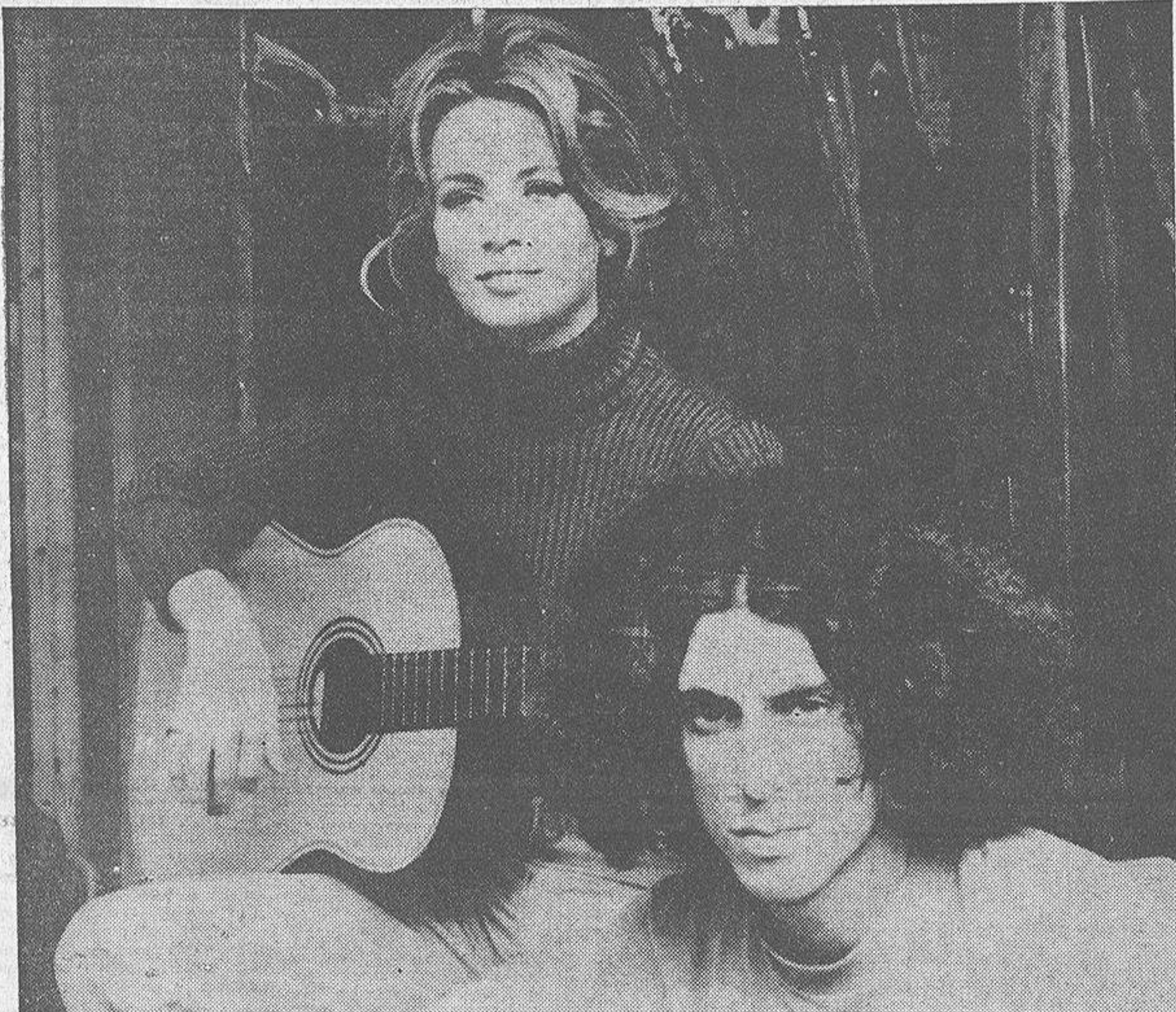
Los "hippies" continentales parecen haber convertido la inacción en norma. Sólo, de vez en cuando, rasguean una guitarra y se ponen a interpretar unas canciones en las que se exalta el amor y se condena la guerra

Confort y bohemia, polos de unas posiciones contrapuestas