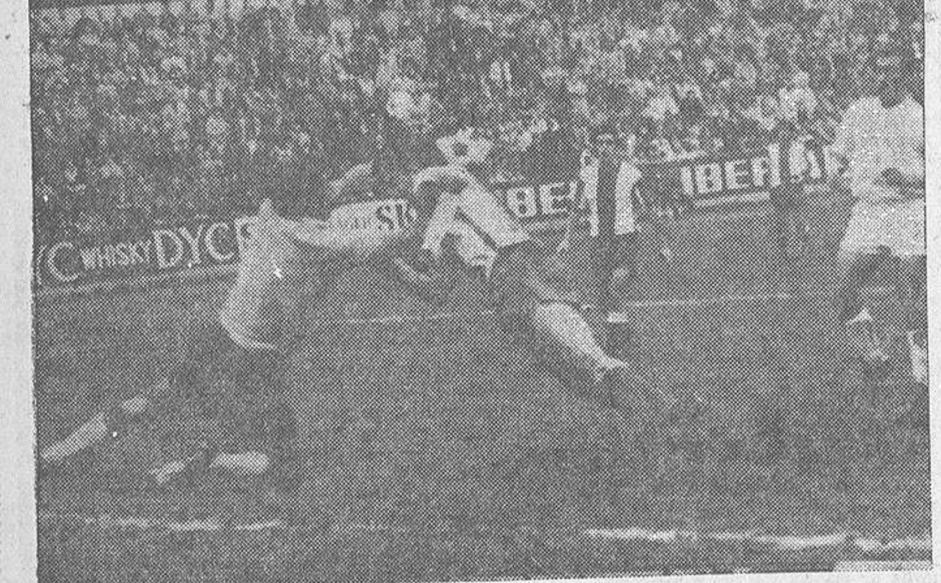
Esta vez, Landa tampoco convenció. Pero luchó y anduvo en la brecha, disputando valientemente todos los balones que los medios, defensas y extremos blanquiazul es "colgaban" sobre el marco defendido por Deusto. En esta bella jugada, captada por la cámara de Quián, vemos al portero visitante sacándole el balón de la misma cabeza al "numero nueve" local.