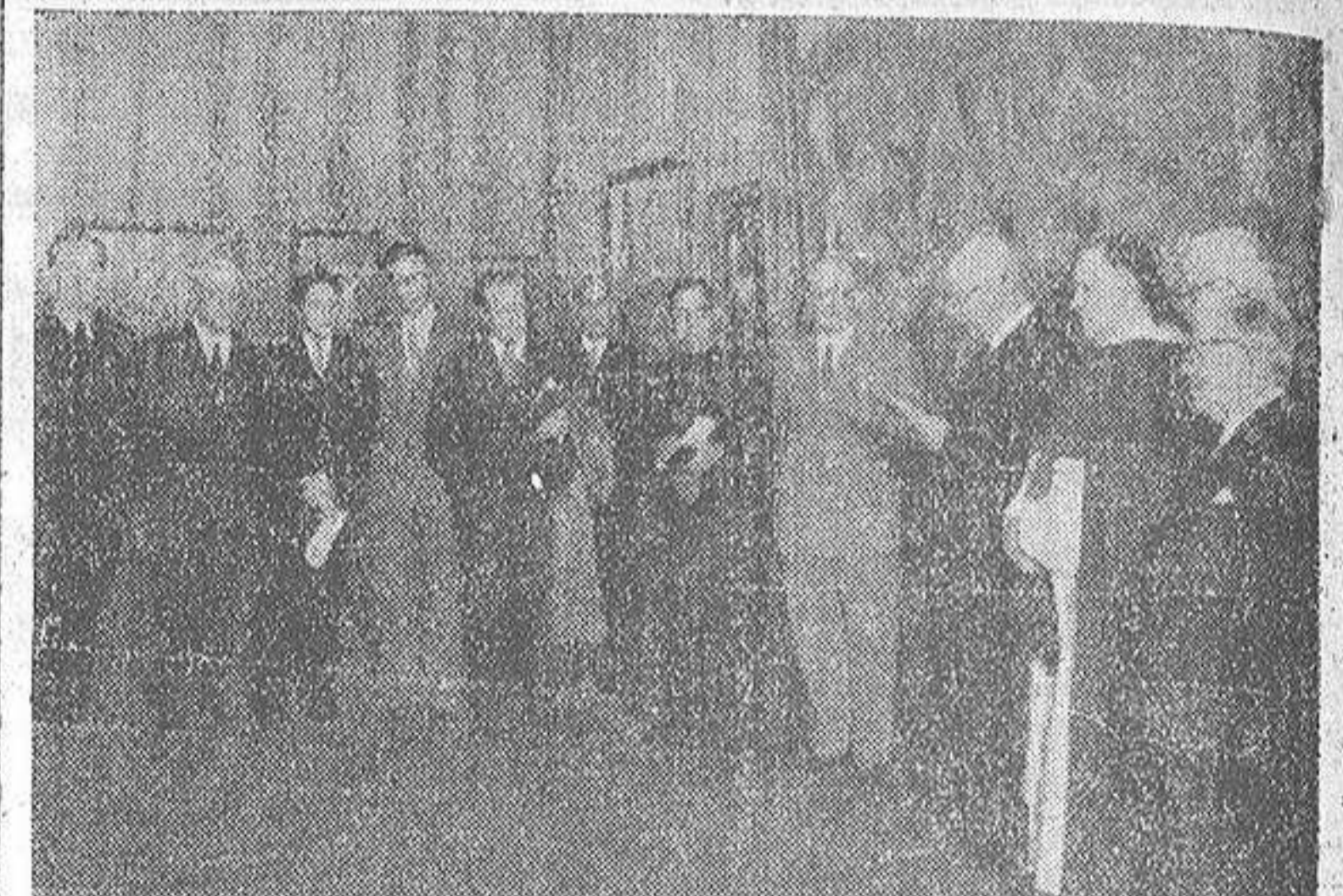
Concurrentes al acto inaugural de la Exposición de pinturas de Germán Taibo, organizada por la Real Academia Provincial de Bellas Artes de La Coruña

En el hermoso salón de la planta baja del Palacio Municipal, ha sido inaugurada el sábado último la exposición de pinturas del malogrado pintor coruñés Germán Taibo, organizada por la Real Academia Provincial de Bellas Artes de Nuestra Señora del Rosario.