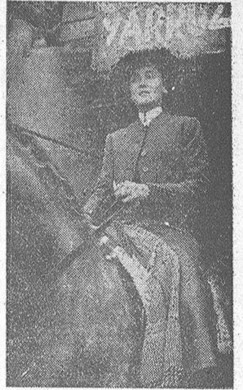
CONCHITA CINTRON, gentil caballista que ayer fué aplaudidísima en la Plaza de Toros coruñesa.

sartado, de tal modo que el público se puso en pie creyéndolo herido de gravedad, y al verlo liso le tributó una ovación clamorosa; merecida ciertamente, pero que no debe Luis Miguel obtener a esa costa porque le sobran facultades para arrostrar.