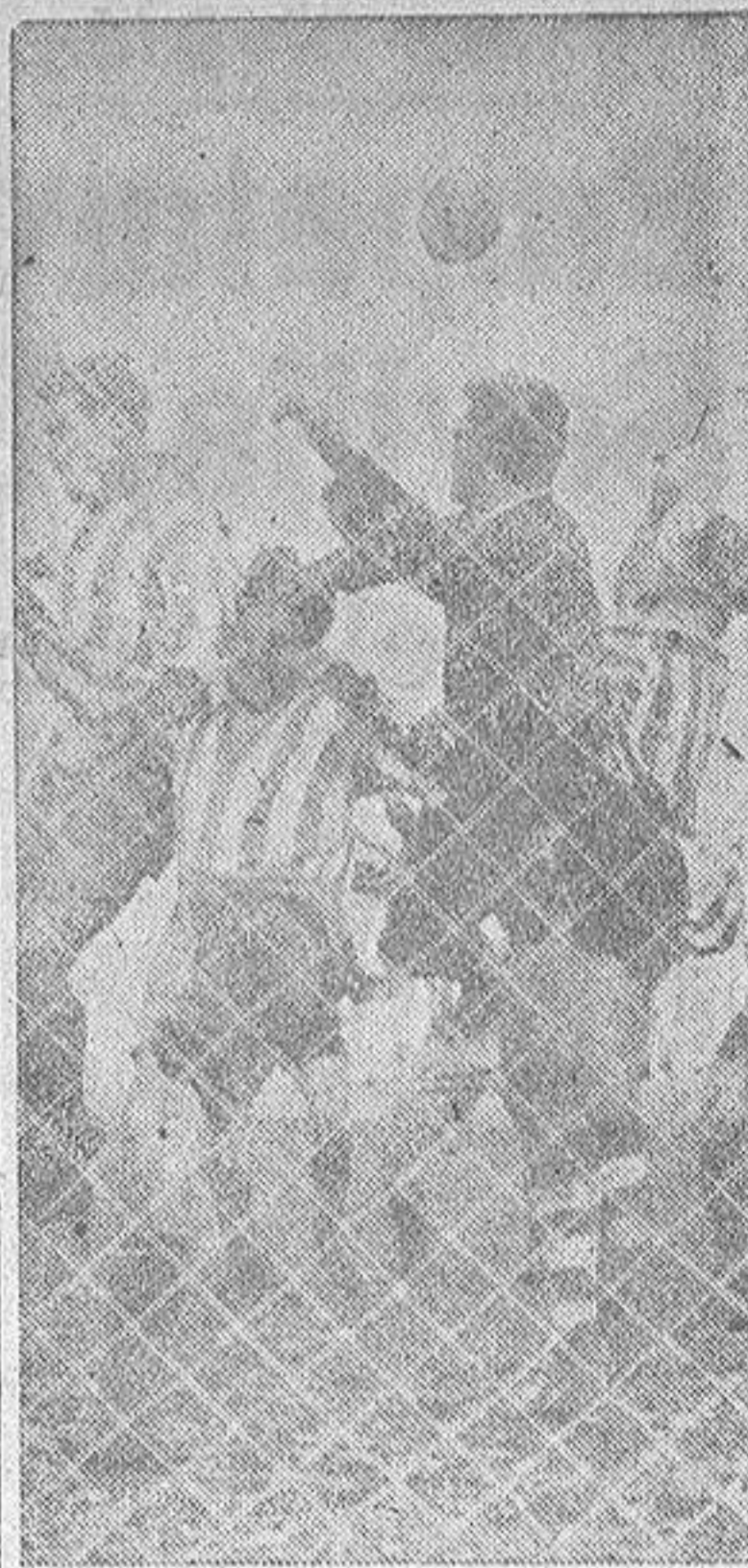
Ante el peligro de un gol inevitable, Arteche elevó el puño y despejó la pelota. Fué el penalty que Cuenca transformó en gol.

Esta manera de actuar se patentiza singularmente en la línea delantera, con su juego suelto y resolutivo que desdeña la alfilería y el entretenimiento para