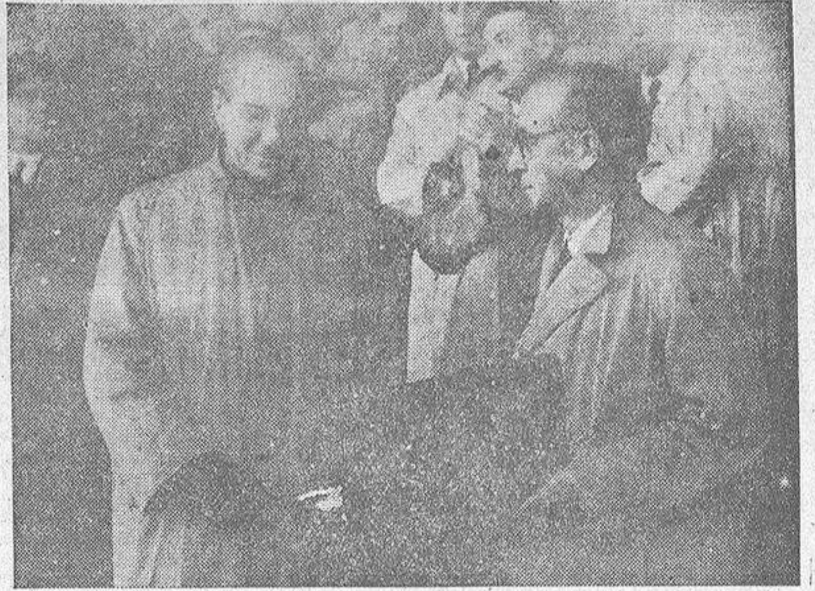
El presidente del Deportivo hace entrega al señor Salvador y Merino del fajín, que le regala el Club del que es presidente honorario