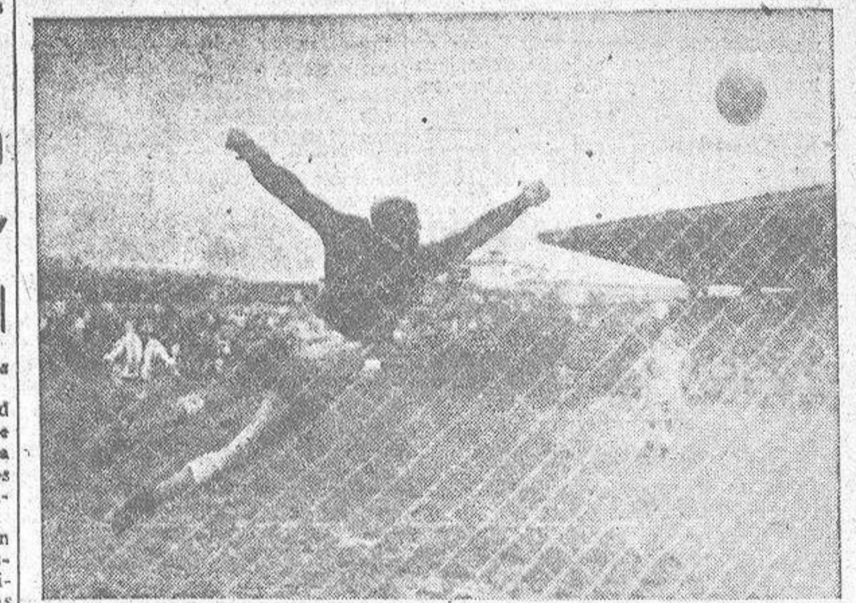
Este fué el segundo tanto de los coruñeses en el partido de ayer. Con él comenzó la tranquilidad en las gradas