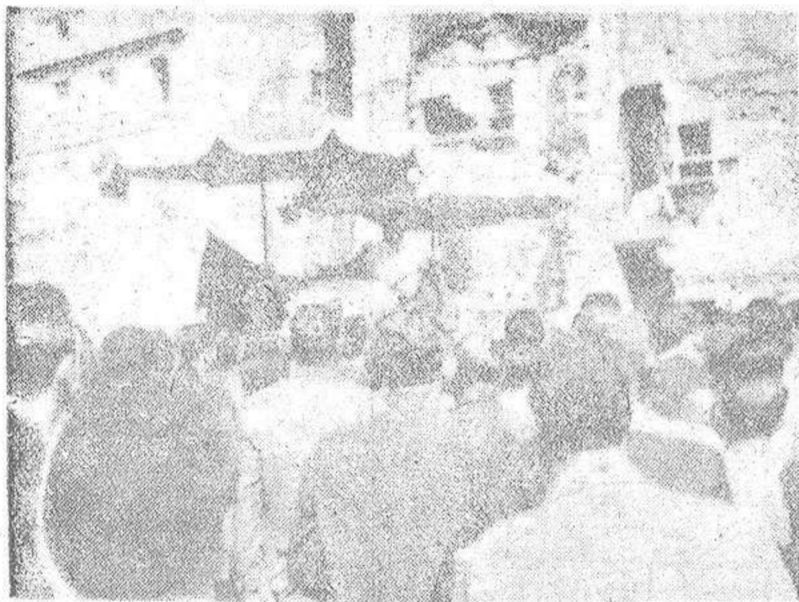
Ya está dando rendimiento el solar del Camaranchón. Ahí lo tienen ustedes de lonja para toda clase de gangas. Esta es la auténtica ley de solares, que, mediante un arrendamiento remunerador puede dar frutos valiosos para la hacienda municipal.—(Foto BLANCO).