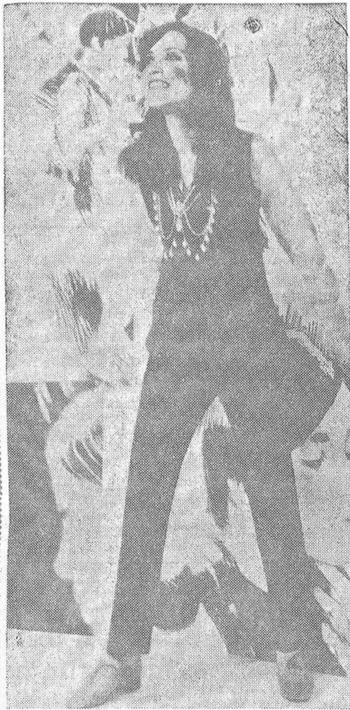
Esta linda jovencita constituye una clara prueba de estilo "hippie", que por esos mundos hace verdadero juror. Sus características son los dibujos en las mejillas que tanto recuerdan a las calcomanías de los niños, amén de abundante bisutería y vestidos de fantasía. En suma, se trata de un estilo llamado a desaparecer muy pronto. Los más optimistas creen que se trata de una extravagancia que no durará más allá de la próxima temporada veraniega