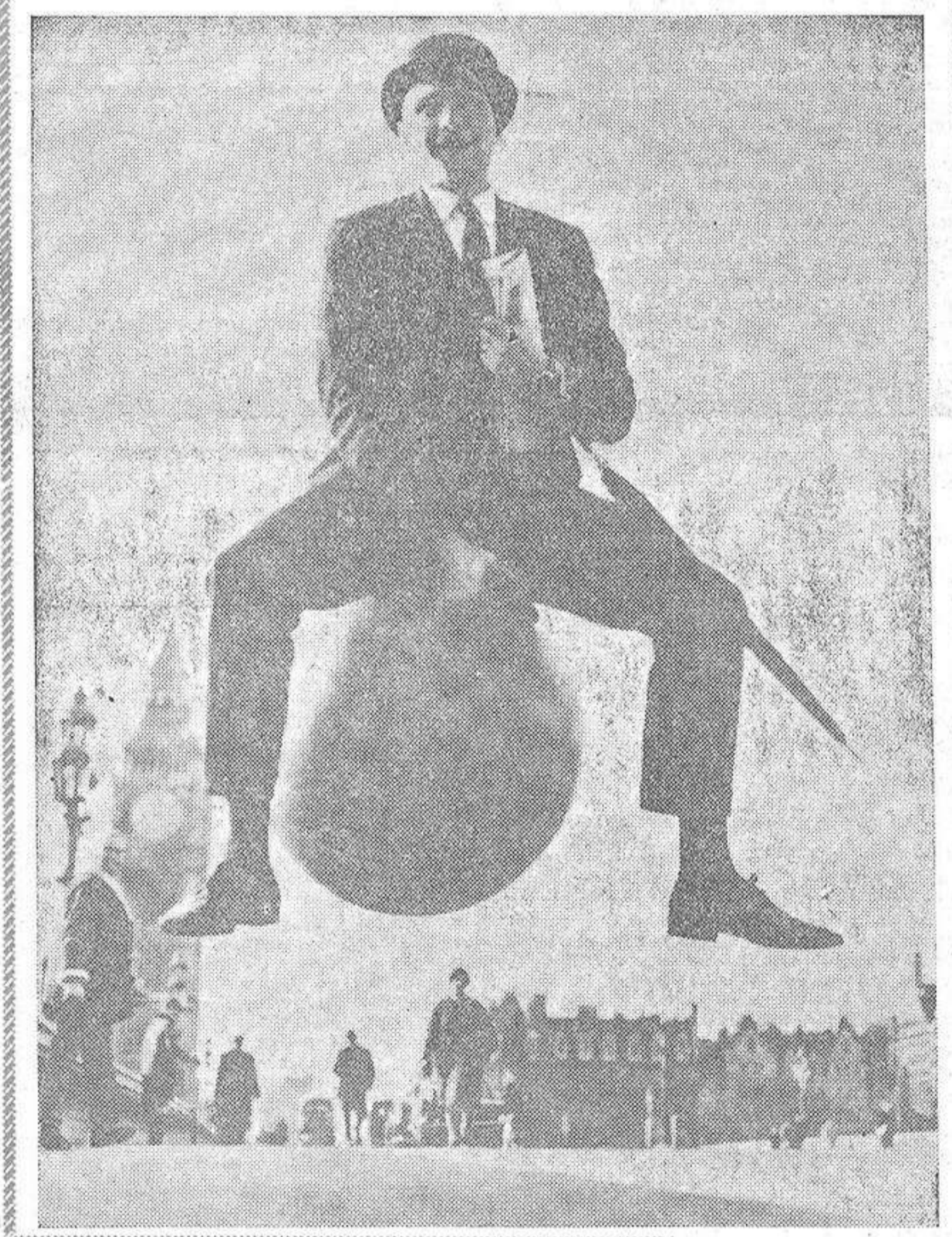
He aquí una experiencia con el invento del inglés Sir Stanley Tozer. Se trata de un gigantesco balón que permite alternar pasos y saltos. Ante las virtudes que el truco en cuestión parece encerrar, no faltan los humoristas capaces de aconsejar al equipo olímpico que en el próximo octubre se traslade a Méjico que vaya provisto de estos artilugios. El mismo consejo se da a Channel para que abandone totalmente el proyecto de construir un túnel bajo el Canal de la Mancha, ya que, con un "buen salto", se podría volar hasta la costa francesa. Existen también los que consideran el invento de Tozer como un arma excelente para los soldados del futuro. Algo parecido, en suma, a aquellos dispositivos de muñe que fueron probados por los soldados americanos y que luego, convertidos en juguetes, hacían las delicias de los niños. De cualquier manera, la moda ha sido lanzada y su inventor espera obtener de ella muy saneados ingresos