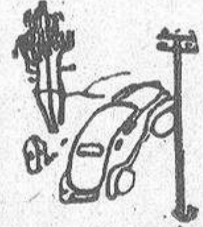
Por la carretera de Ferrol a Betanzos rue-

da un desvencijado "Ford", modelo muy antiguo. Va repleto de paisanos. A la velocidad del rayo basa un "Hudson" en la misma dirección.