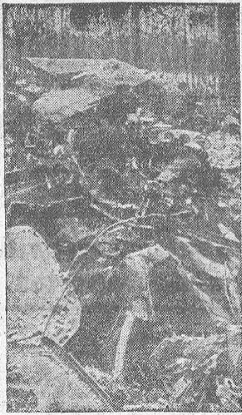
He ahí lo que quedó de un avión norteamericano de bombardeo al ser abatido. Algunos miembros de la tripulación se salvaron con paracaídas

Y tú quizá tienes miedo a las corrientes disolventes que nos asolan; tal vez te quite el sueño el porvenir espiritual de tus hijos. Pero no ves que la A. C. es la única defensa eficaz de estos valores morales? Suscríbete tu Tarjeta en la Parroquia.