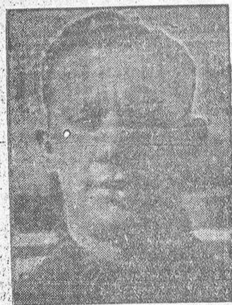
EL JOVEN GUARDAMETA INTERNACIONAL QUE EN EL DECISIVO PARTIDO JUGADO AYER TARDE EN EL CAMPO DE CHAMARTIN, MANTUVO INCOLUME LA PORTERIA DEL R. CLUB DEPORTIVO

Los dos primeros encuentros se han jugado, el primero en Barcelona, y el segundo en Madrid. Los de la Copa de S. E. el Generalísimo, en los campos de los clubs citados en primer lugar.