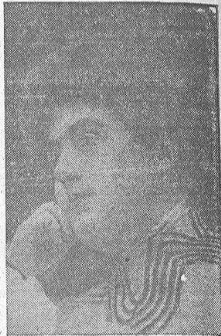
LA PARSÍ EN EL AÑO 1907

—¿Muy caro? —No. Los proscenios estaban todos abonados, igual que los palcos primeros y segundos. Las plateas, que sub-