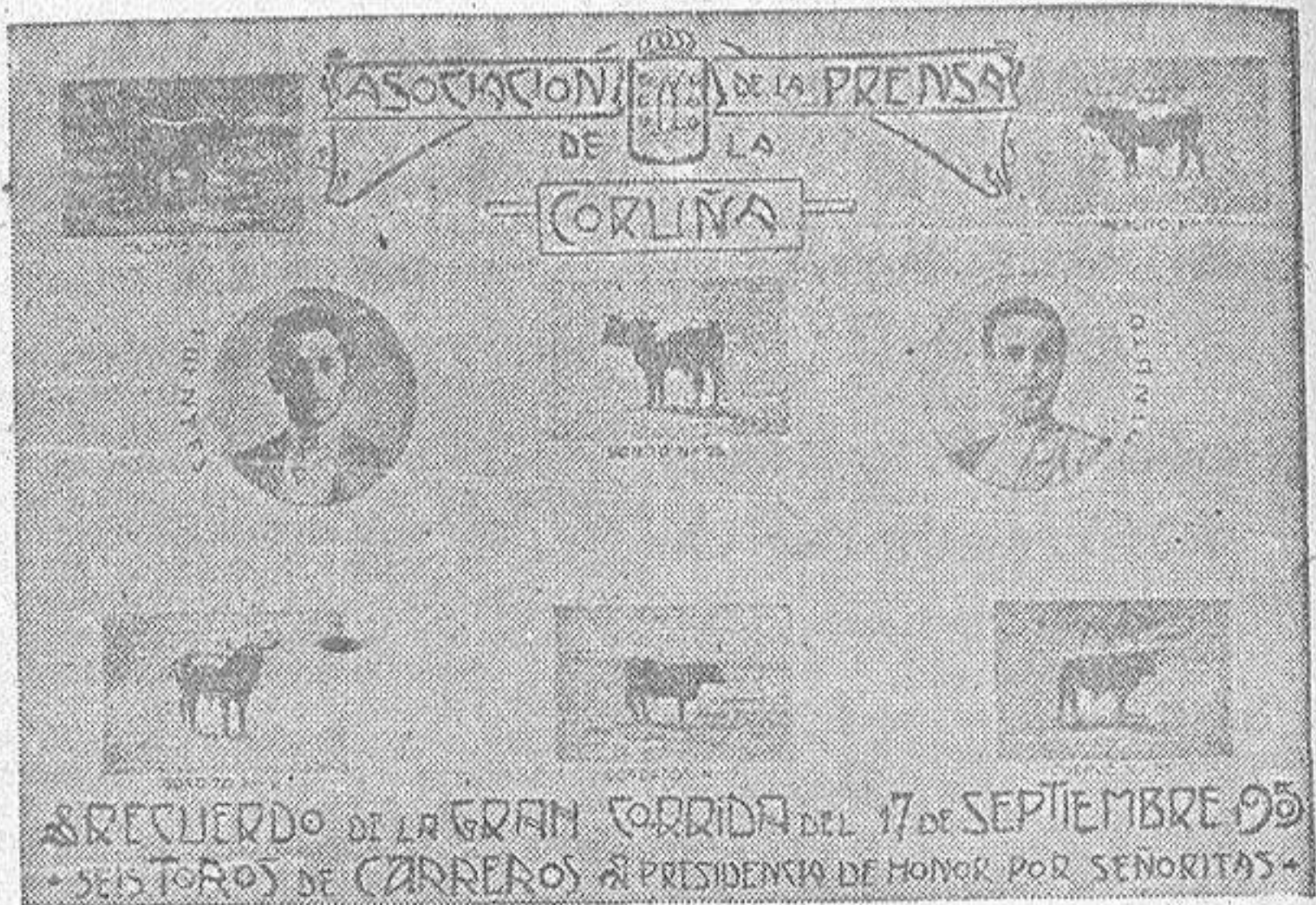
Tarjeta postal que circuló profusamente con el anuncio de la primera corrida de toros organizada por la Asociación de la Prensa de La Coruña, en Septiembre de 1905

Entre las nueve o diez plazas de toros de que será empresario Pagés esta temporada, figura la de La Coruña. Y alguien me pregunta: