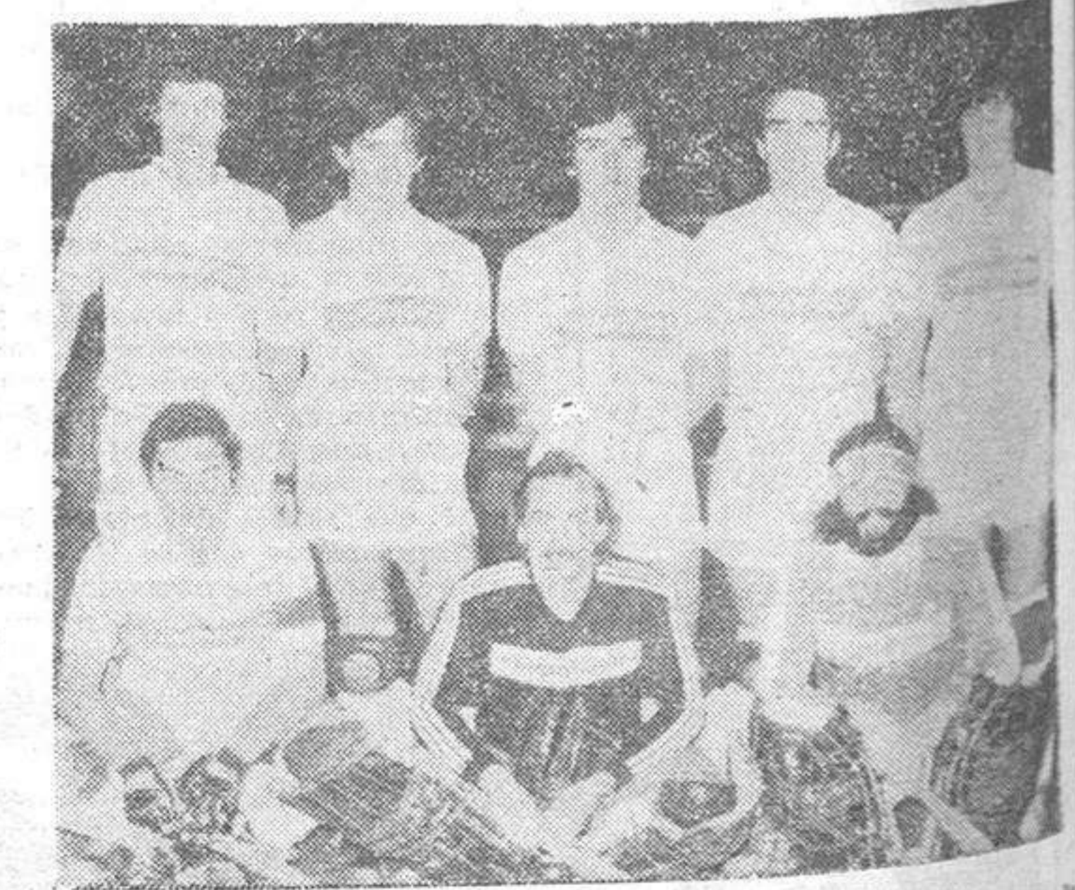
El equipo del Dominicos, de hockey sobre patines, que está realizando una magnífica campaña en Primera División.

Buena entrada en la Polideportiva y nuevo triunfo del Dominicos, esta vez, sobre el San Antonio, en un partido que resultó muy entretenido, ya que los coruñeses (excesivamente confiados), complicaron el resultado final, ante un equipo que se presumía flojo rival, pero que después en la pista, evidenció buenas maneras, con firmeza en su defensa, cortando bien y menos mal que en ataque no mantuvieron el mismo nivel, pues ocasiones las tuvieron y muy claras ante las facilidades del equipo de Gabriel Ruiz.