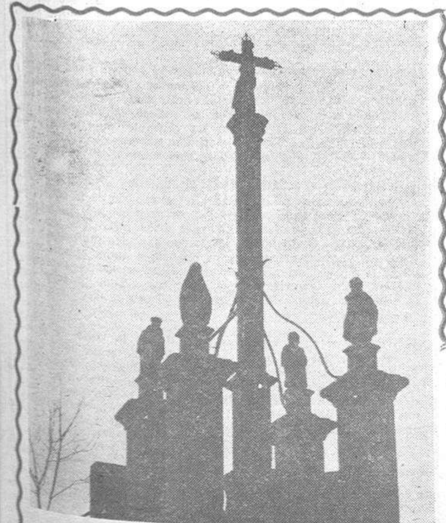
Simbolo perenne de Galicia