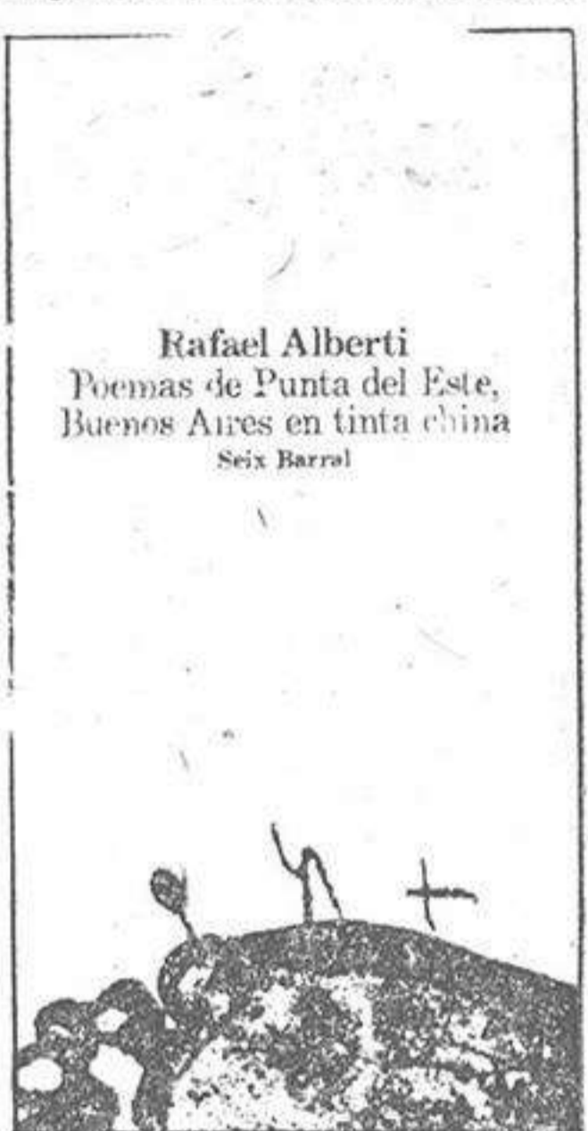
Rafael Alberti Poemas de Punta del Este, Buenos Aires en tinta china Seix Barral

ALGUNOS poemarios poco conocidos de Alberti, se editan ahora en España. Cabe mencionar, entre ellos, a dos que acaban de aparecer. Se trata de "Poemas de Punta del Este" y "Buenos Aires en tinta china" (1). En el primero, se alternan prosas y versos, a la vez que en el segundo es el elemento lírico