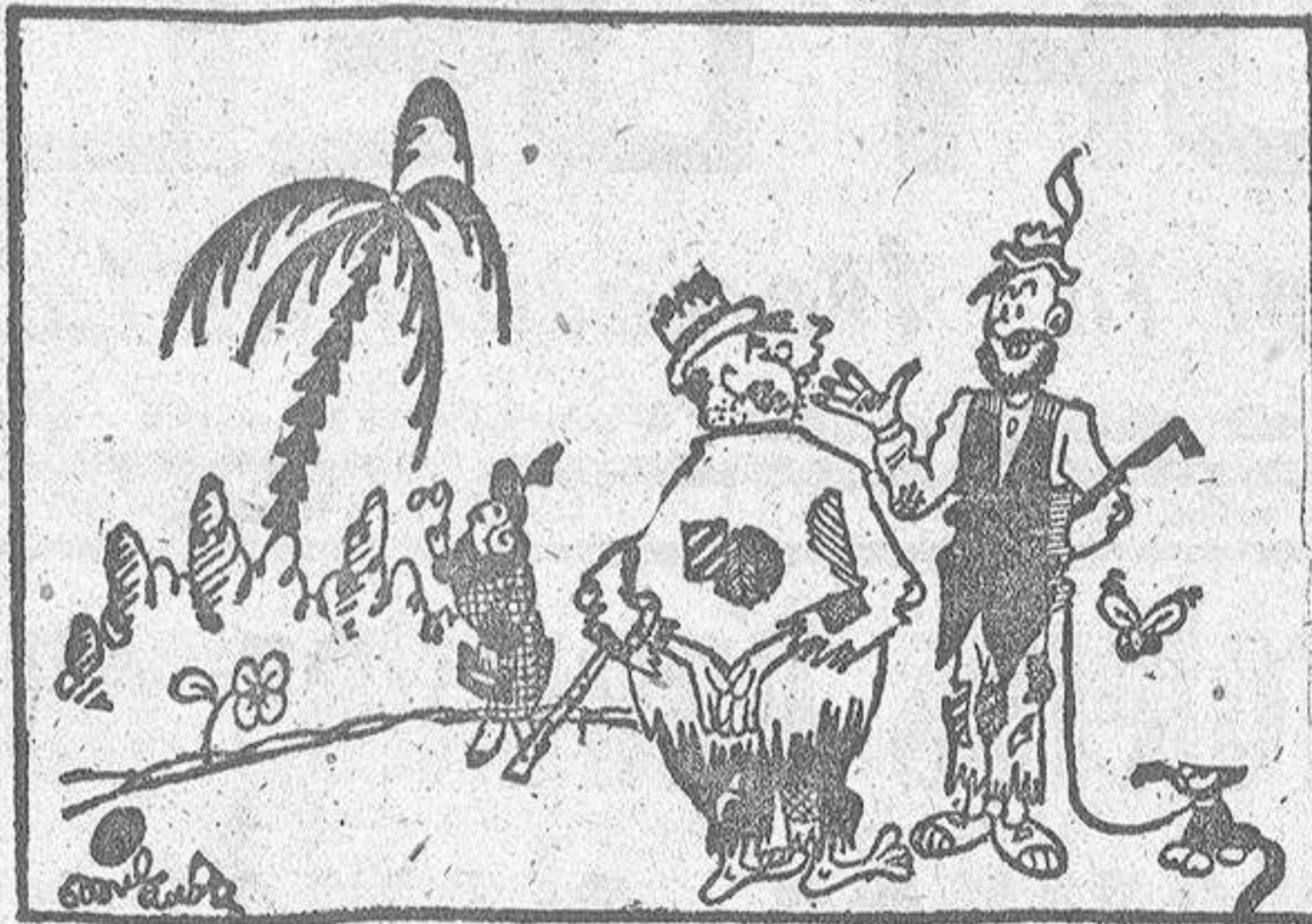
ANTIGUOS AMIGOS, por Miranda —¿Cuánto tiempo sin verte! ¿Cómo te encuentras? —¿Yo? ¡Muy bien! ¿Y tú? —¡Oh! ¡Yo divinamente!