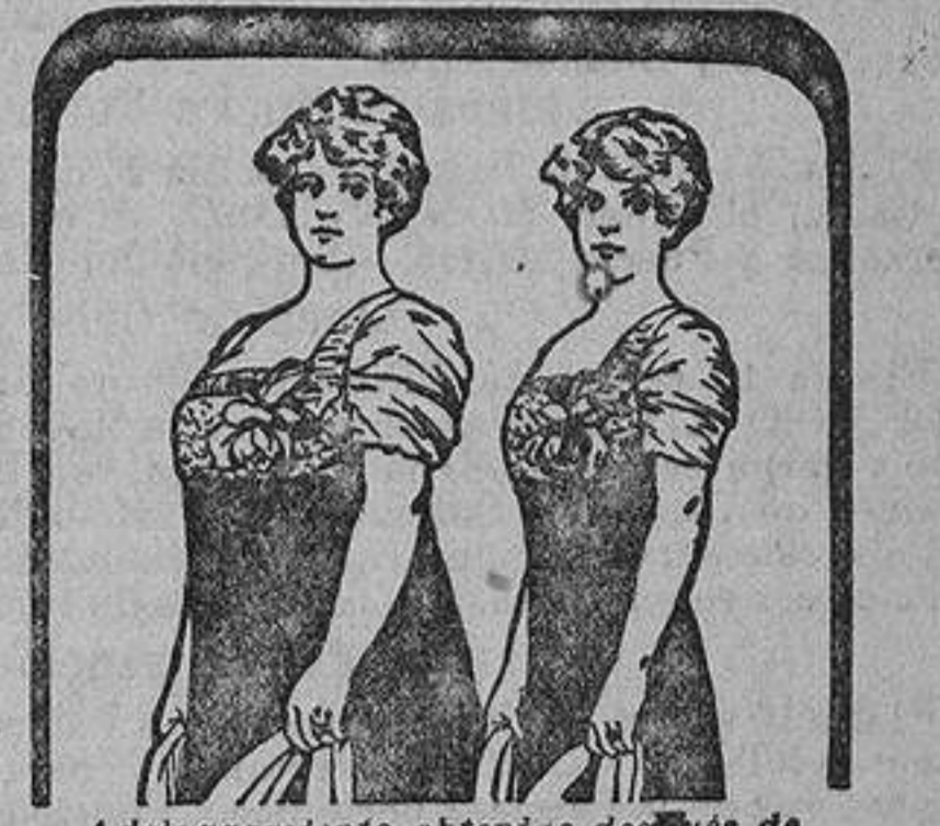
Adelgazamiento obtenido despus de 3 meses de cura por la IODHYRINE.

La mejor marca, 1,15 y 1,50 medio kilo. Esparteros, 10, ultramarinos, tel.º 2.977.