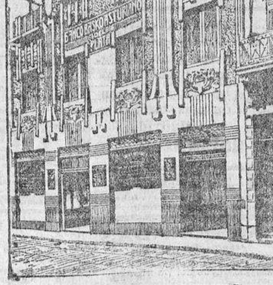
EDIFICIO DEL BANCO

Agua vegetal de Arroyo, prem.ª en varias Exposiciones científicas con medalla de oro y plata; la mejor de todas las conocidas hasta el día para restablecer progresivamente los cabellos blancos á su primit.º color; no mancha ni la piel ni la ropa; es inofensiva, tónica y refrescante en sumo grado, lo que hace que pueda usarse con la mano, como si fuese la más recomendable brillante. Venta en perfumerías y peluquerías de Madrid y provincias.—Depósito central: Preciados, 56, prat.