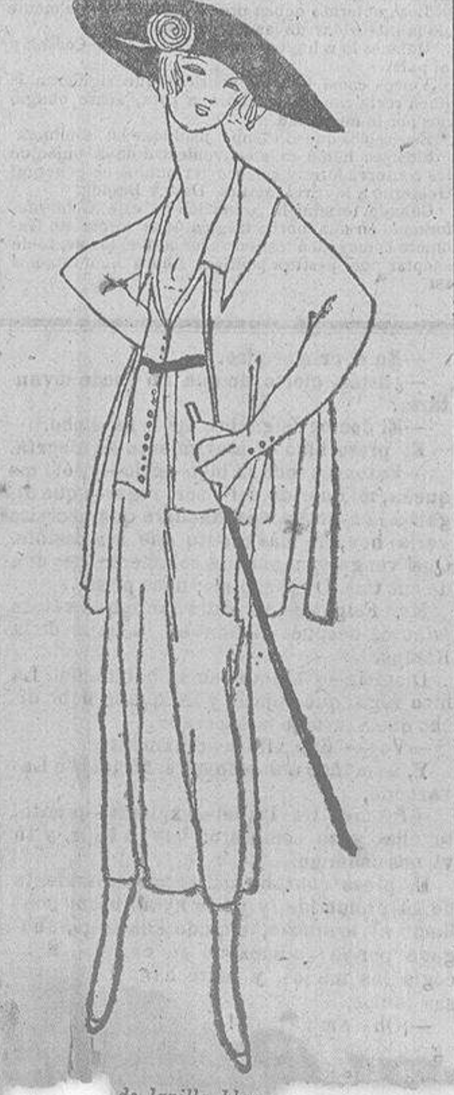
de lanilla blanca