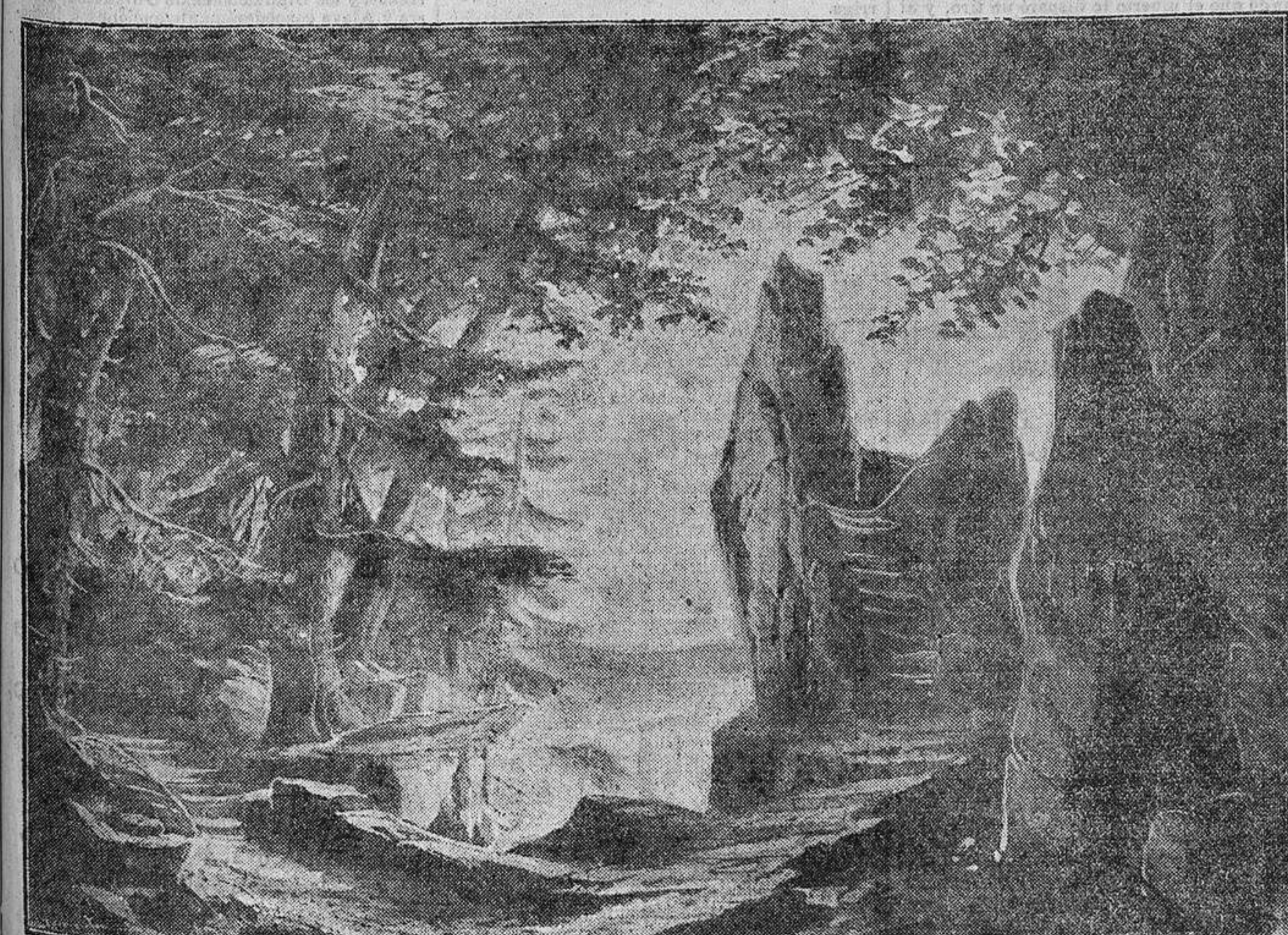
UNA DECORACION de «El Ocaso de los Dioses».—Autor, Amalio Fernández.

Woginda, Wellgunda y Flosshilda, hijas del Rhin, tratan de convencer á Sigfredo de que