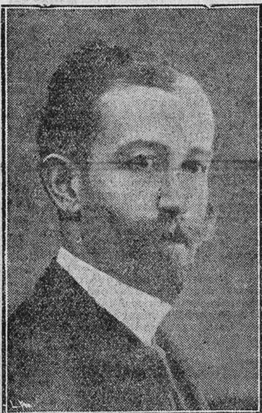
El maestro alemán Rabi, que dirigirá en el teatro Real «El Ocaso de los Dioses».