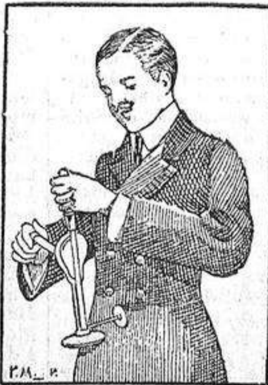
Las vibraciones del VEEDÉE vigorizan enérgicamente el estómago.

Buena Salud y El Buen Semblante (que gratuitamente entregamos á la persona que lo solicita), la lista de las múltiples aplicaciones á que se presta el VEEDÉE en toda casa de familia, para experimentar al pronto una sensación de asombro, sensación que bien puede degenerar en otra de incredulidad, motivada sin duda alguna por la multitud de abusos que en Madrid han cometido diferentes ESPECULADORES sugestionando nuestro público con anuncios llamativos, propagando aparatos y específicos, sin otro resultado positivo que el lucro comercial. Efectivamente; estamos tan cansados del charlatanismo y tan acostumbrados á leer esos prospectos de productos MARAVILLOSOS, ofrecidos como CURALO-TODO, que, en realidad, sentimos tentaciones de sonreír cada vez que se nos habla de alguna PANACEA UNIVERSAL, susceptible de realizar toda clase de prodigios curativos, SIN OTRA GARANTIA QUE LA SUGESTION DE LOS ANUNCIOS.