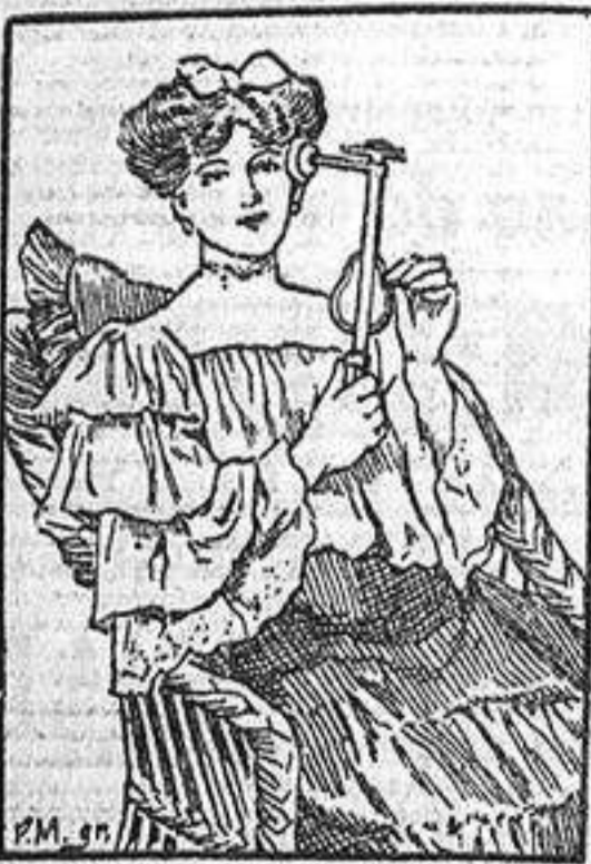
El VEEDÉE cura estas enfermedades en poco tiempo.