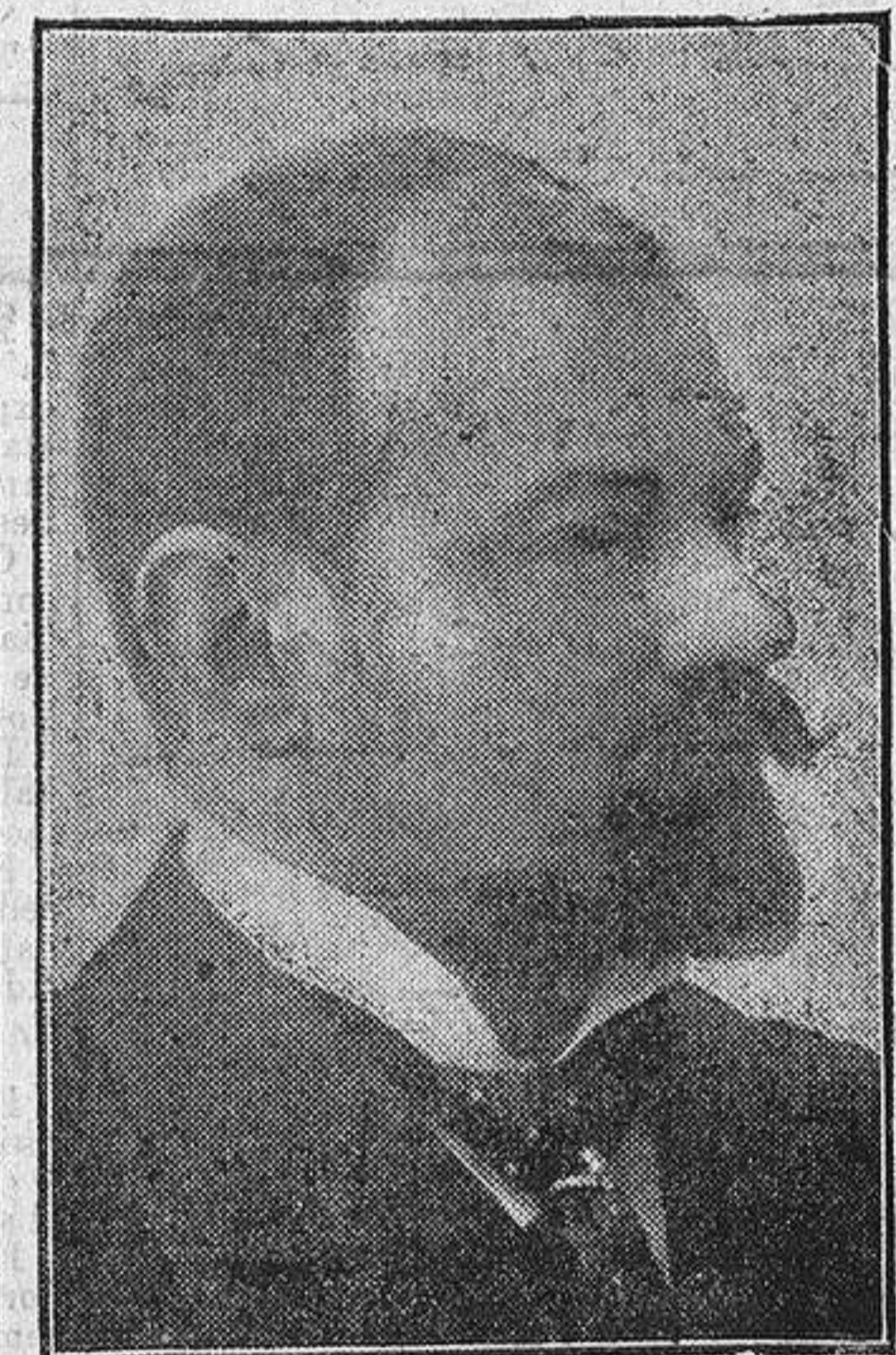
CARLOS FERNANDEZ SHAW, autor de la letra de Margarita la Tornera .

jamás se apagaron sus entusiasmos. Su tenaz voluntad capeó todos los temporales, seguro de sí mismo, audaz en sus iniciativas, revolucionario en sus procedimientos, entusiasta por el arte nuevo, dominador de la idea, fecundo hasta lo imposible, y siempre inspirado, siempre feliz y siempre elegante. Porque, señores, bueno es que se sepa; pero no por eso no hemos de repetir una vez más: Chapí, autor de piezas del género chico, y yo guardo para los libros de esas obras todos mis respetos, jamás descendió al te-