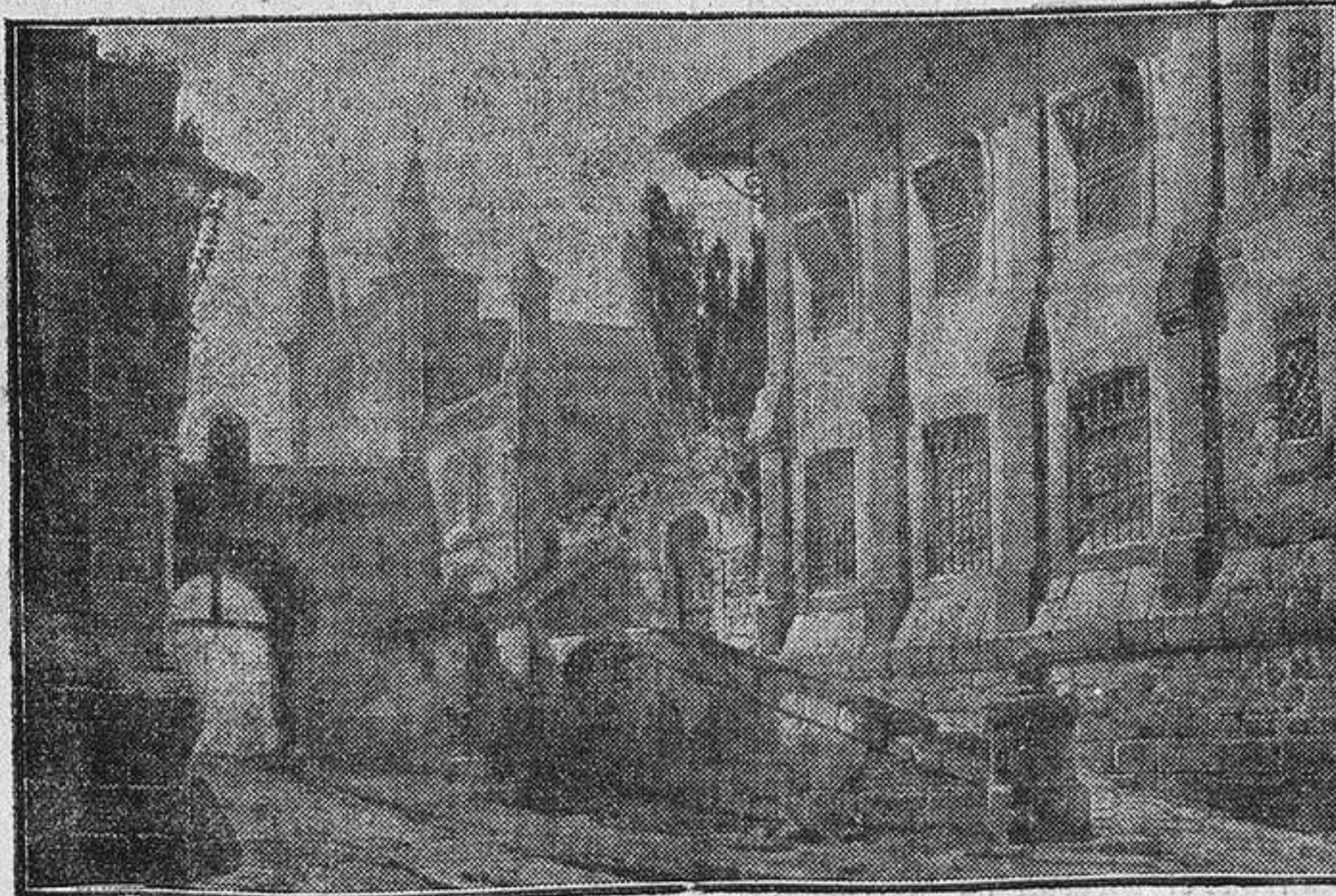
Decoración del acto primero. -- Cuadro segundo.

ESCENA III. —Llega el criado Gavilán, que ahora está al servicio de Don Lope. No por eso fué abandonado el de Don Juan, sino que, por el contrario, lo hace así por mejor servicio, pues de este modo puede vigilar á su sabor al rival de su señor.