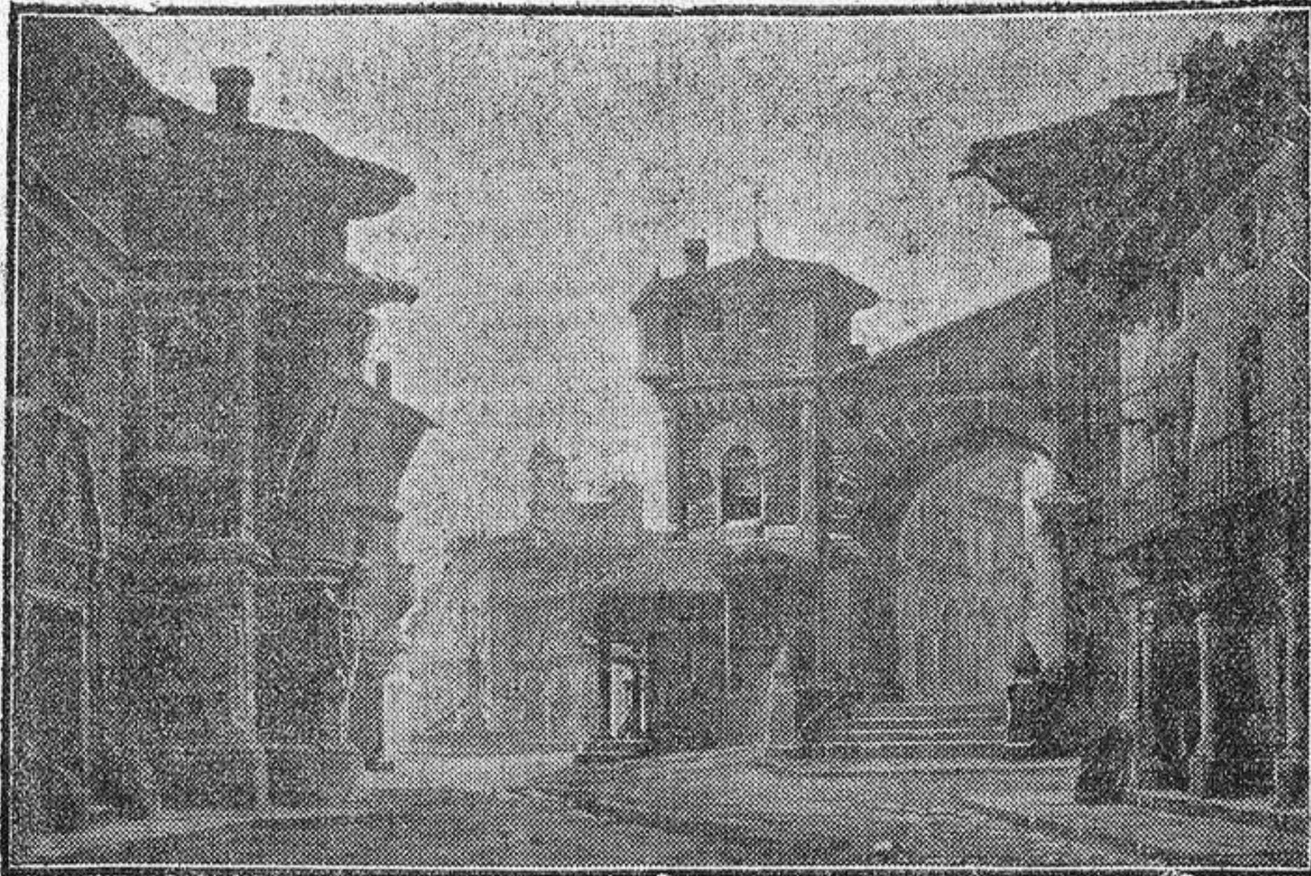
Decoración del acto primero. -- Cuadro primero.