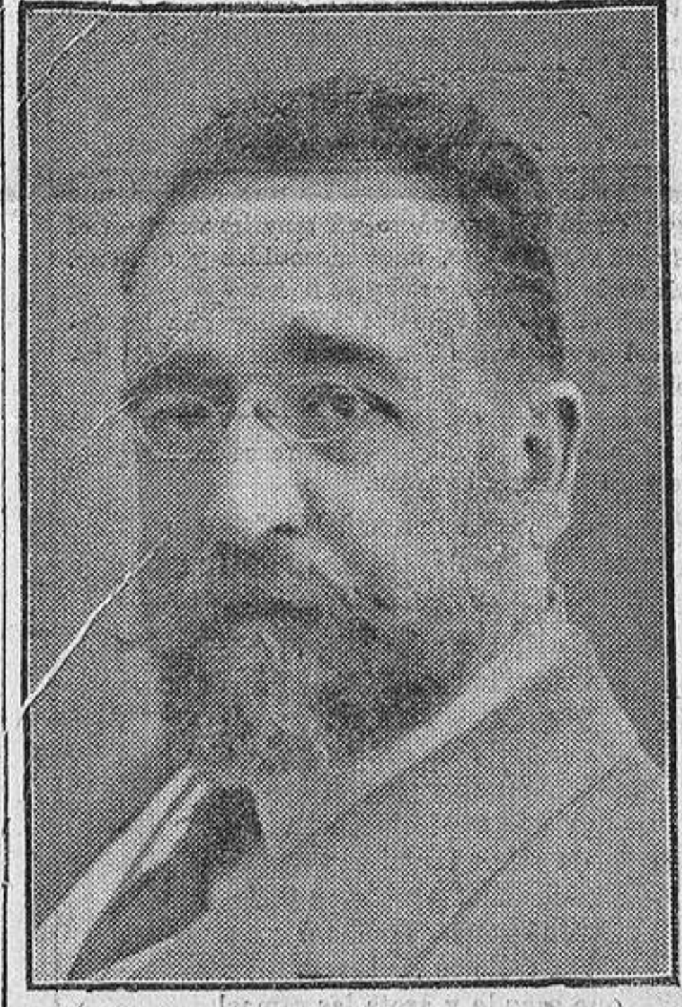
RUPERTO CHAPÍ, autor de la música de Margarita la Tornera .

aquel animado y valiente, mientras que el criado se muestra temeroso y cobarde. En vano trata de disuadir á su amo de lo peligroso de la aventura que pretenden y para la cual han encaminado hasta allí sus pasos. Sus ruegos y sus lamentaciones no hallan eco en el ánimo de Don Juan, que está decidido á robar á Margarita.