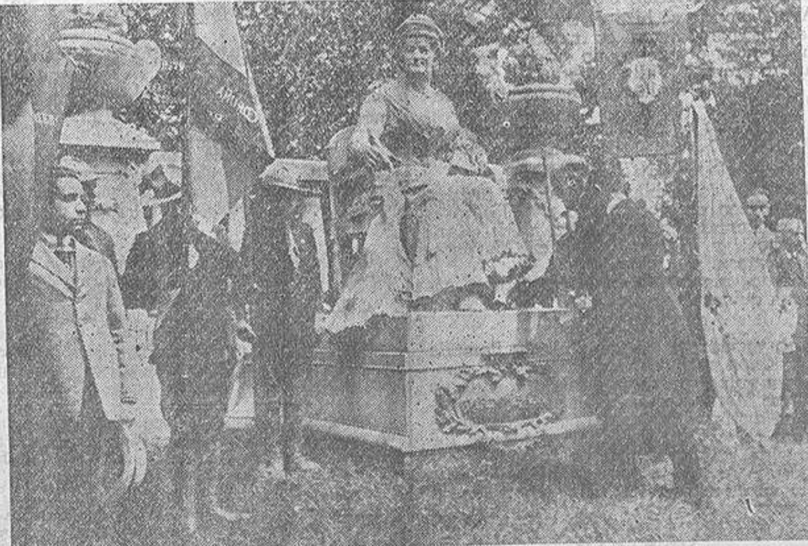
El Alcalde depositando flores a los pies de la estatua

Rodeando su estatua, están hermanados el Ejército y el pueblo, los representantes de la ciencia y del arte, de la industria y del comercio, de la oración y del labio. Todos