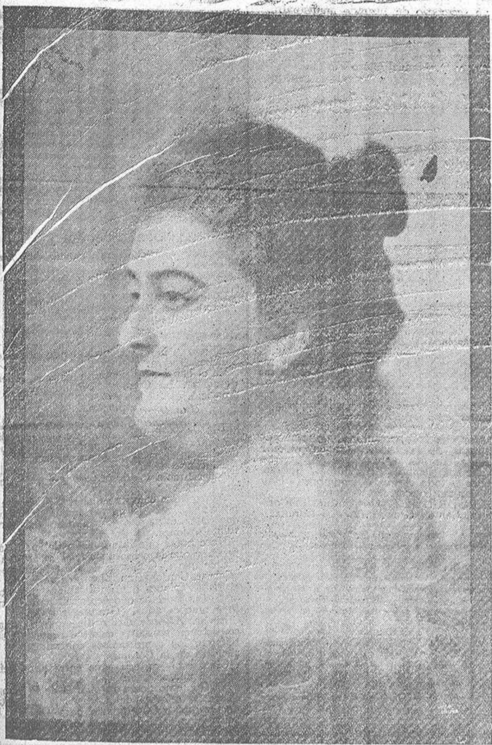
(Reproducción del famoso retrato, obra de Joaquín Vaamonde)

ni no fue ya jamás rectificado, sino que, por el contrario, su rumbo y su carácter quedaron definitivamente impresos en toda la larga y gloriosa marcha de esa vida repleta de acción y de expansión intelectual, que se meja la marcha, rutilante y majestuosa, de un astro a través de los infinitos espacios siderales.