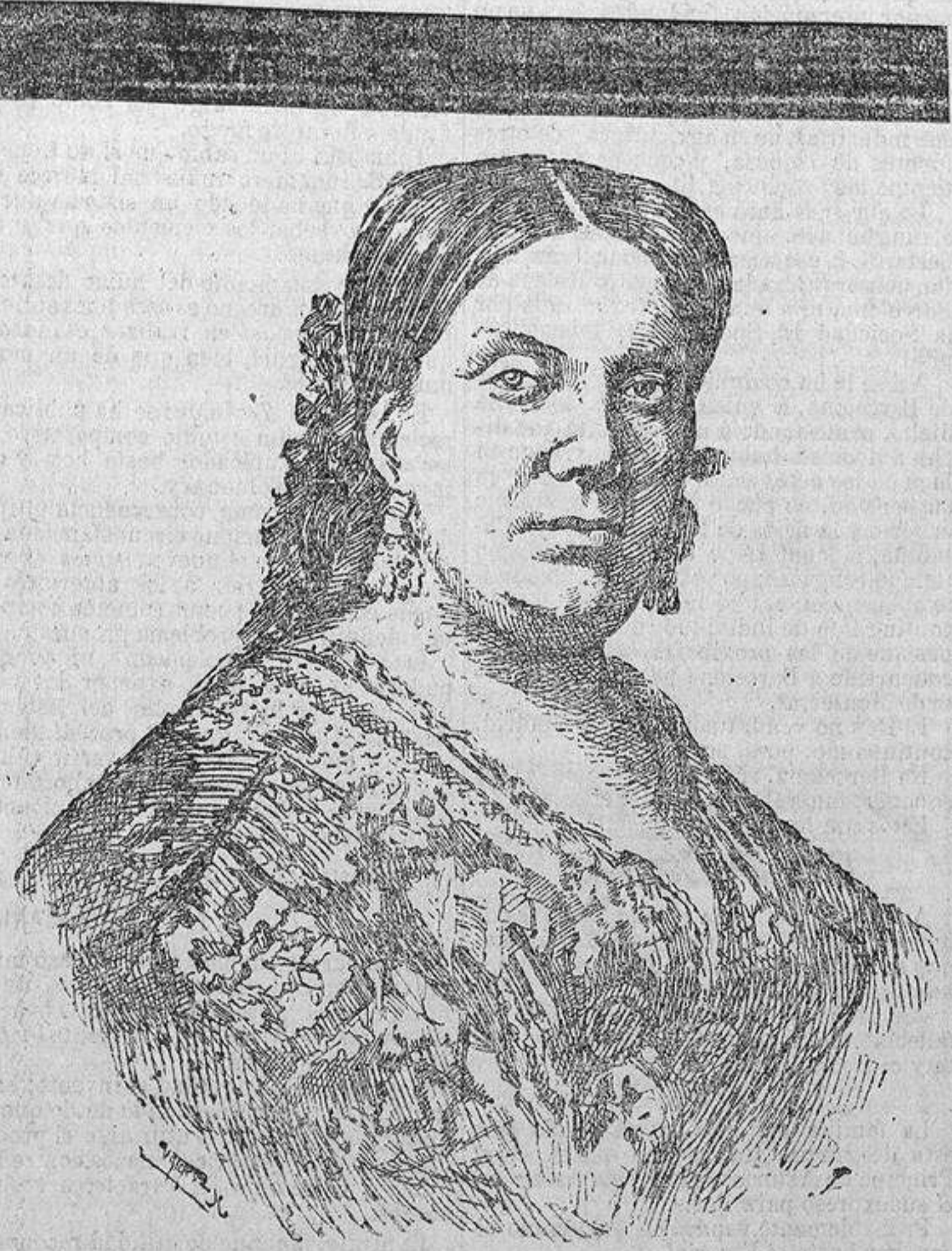
ISABEL II EN 1869