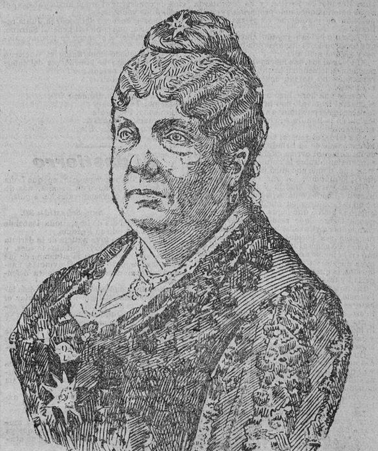
ISABEL II EN 1900

En este momento, y avisado el duque de la Torre, ordenó éste se llamase al brigadier Lacý, que se presentó al frente de sus batallones. El duque cambió un abrazo con este bravo militar á quien dejó en libertad de seguir ó no la causa del ejército liberal: contestó que sus compromisos no le permitían verificar lo primero, y quedando, por lo tanto, con sus tropas prisionero de guerra. El general entonces en uno de esos arranques levantados de generosidad y grandeza, dijo: «Señor brigadier, queda usted en libertad, puede retirarse con todas sus tropas, y atacarlas si gusta. El ejército liberal terminará la obra que ha comenzado de salvar la patria y la libertad economizando sangre. Diga usted de mi parte al general Pavia que