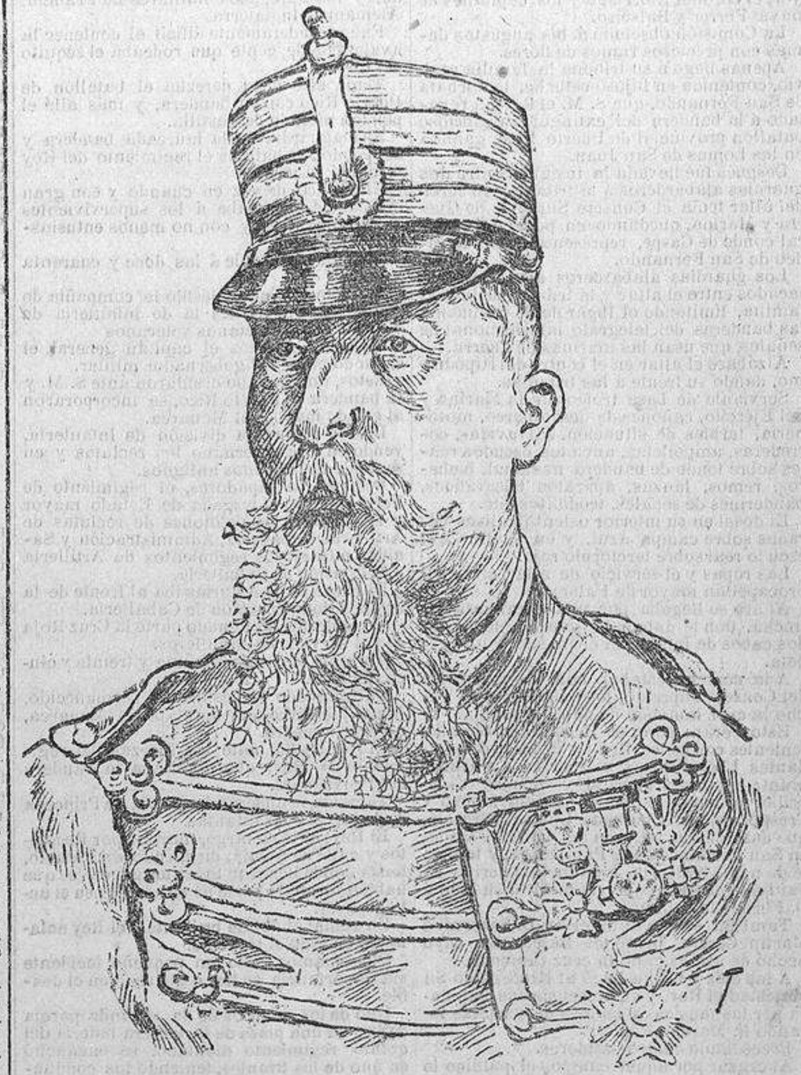
EL CORONEL VARA DE REY muerto gloriosamente en El Caney.