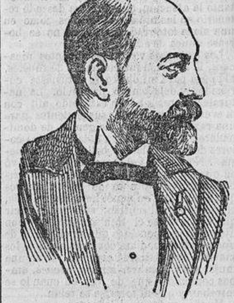
Organizador de la Exposición de Agricultura.