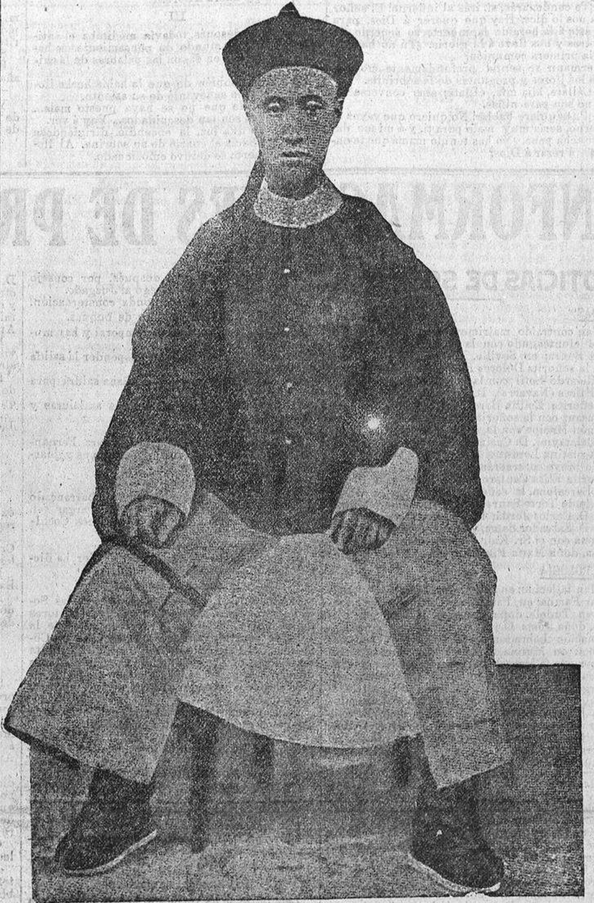
El nuevo Regente del Imperio chino.