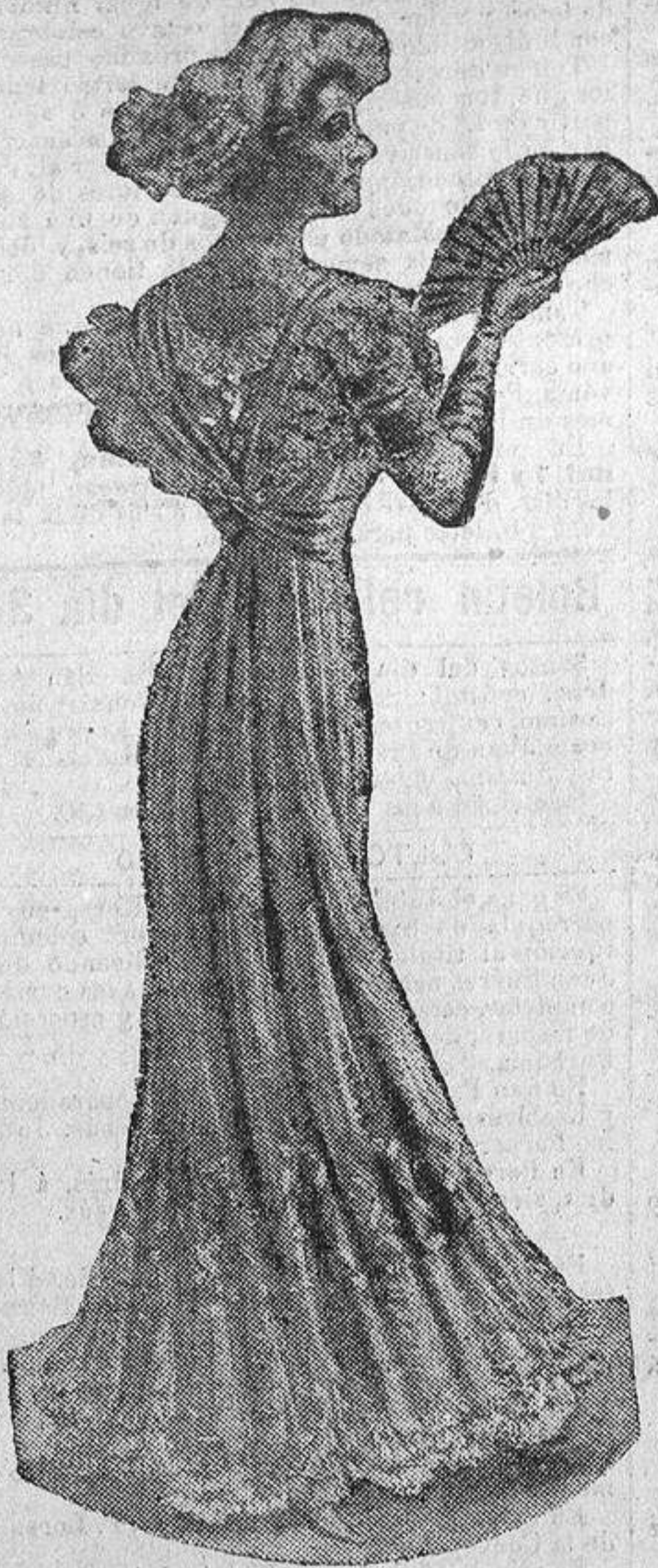
VESTIDO DE BAILE

corto para evitar pisotones. Gasa ó crepón de tonos claros, encajes y bordados de Irlanda.